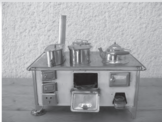
Štedilnik s posodicami za igranje.