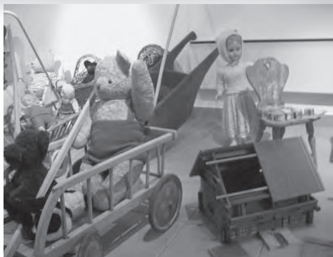
Igrače. V ospredju lesena hišica Matije Milčinskega.