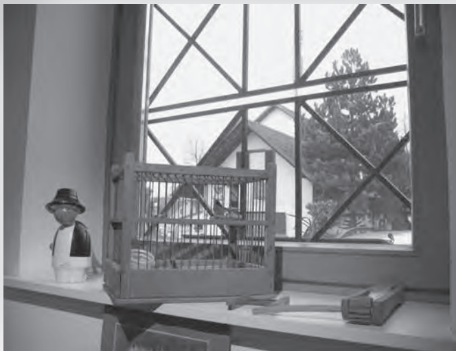
Kmetič iz lesa, ki igra, ko ga naviješ. Doma izrezljana rašpla in gobovž.