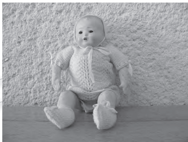
Punčka iz papirmašjeja z gibljivimi očmi, stara okrog 80 let.