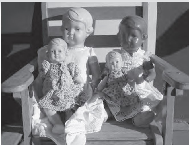
Punčke iz celulojda, ki smo jih dobili otroci iz revnih družin v paketih UNRA iz Amerike.