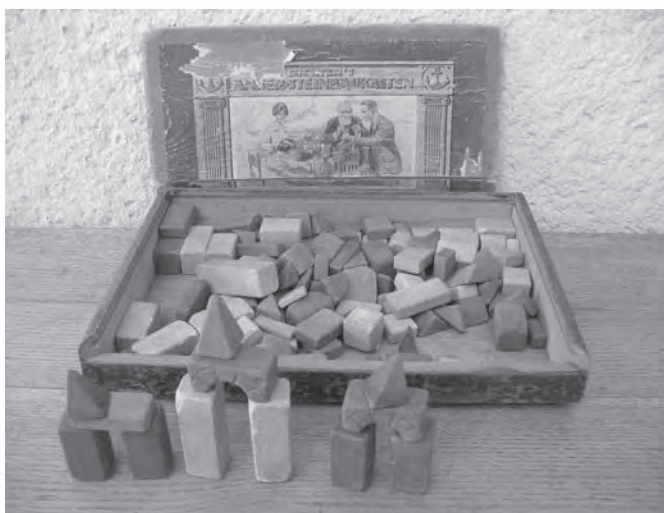
Kocke iz kamnja, stare približno 80 let.