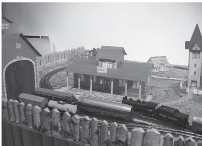
Vlak, ki se premika, je še danes privlačen za otroke.