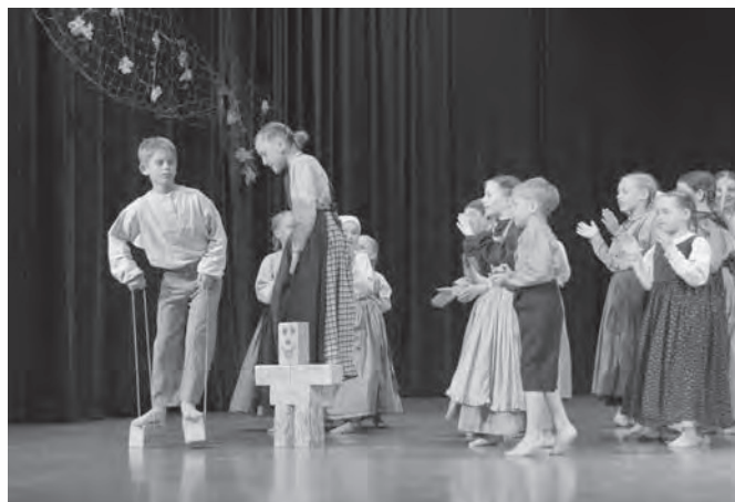
Otroška folklorna skupina Karavanke iz Tržiča med prikazom igre, pri kateri so si pomagali s poleni.