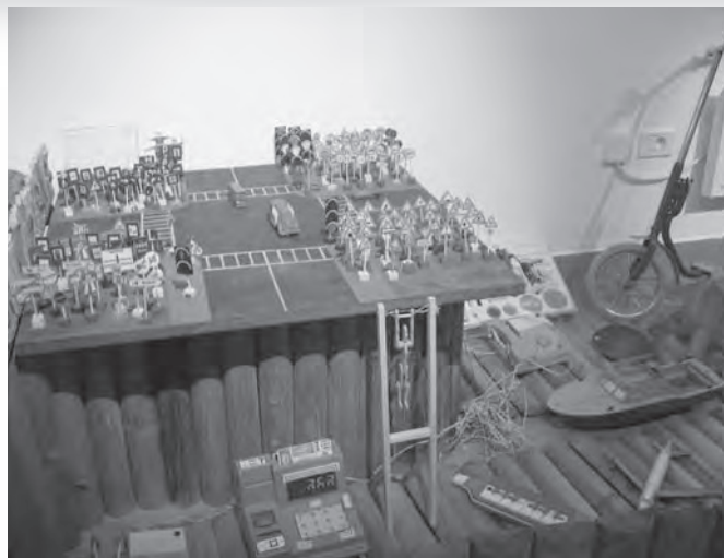
Prometni znaki so bili tudi učni pripomočki.