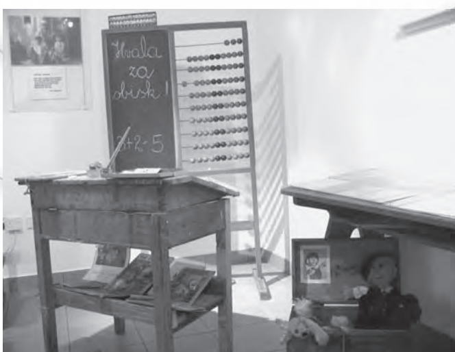
Prikaz šole pred sedemdesetimi leti: klop, računal, lesena tablica, lesena peresnica, steklenička za črnilo in peresnik, stavnica.

smo se največ igrala s pohištvom in ostalo kuhinjsko opremo, punčkami, medvedki. Z didaktičnimi igračami sem se igrala