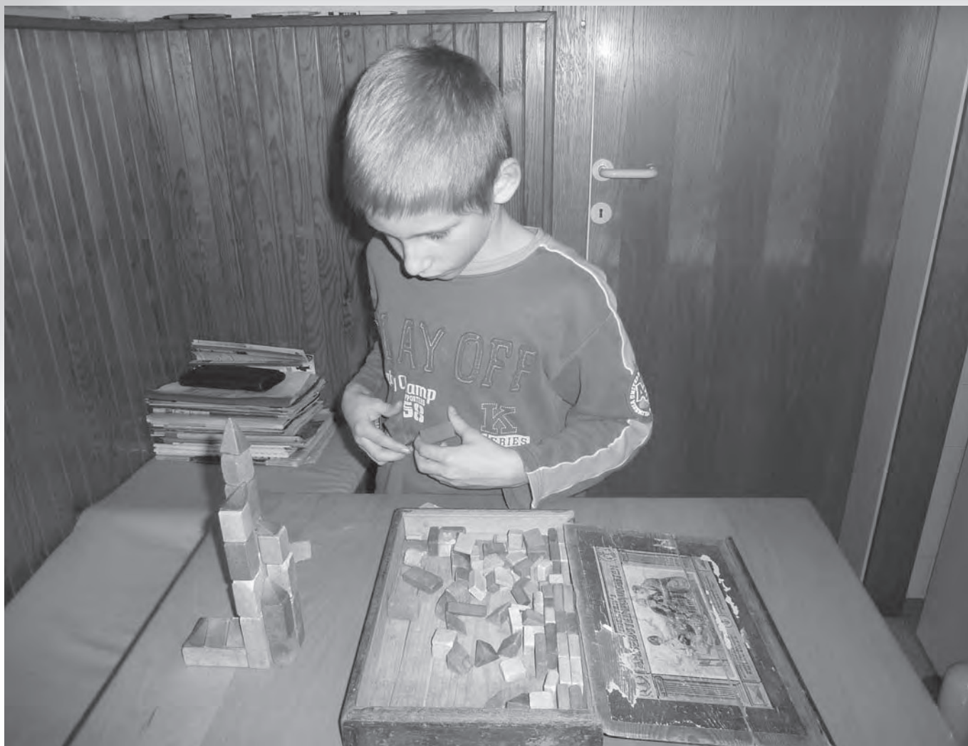
Igra s kockami.

Špano smo sami narisali na karton. Igrali smo s fižolčki. Volka sta bila črna, ovce pa bele. Zmagal je tisti, ki je ovce pripeljal v hlev, ne da bi jih volk požrl.