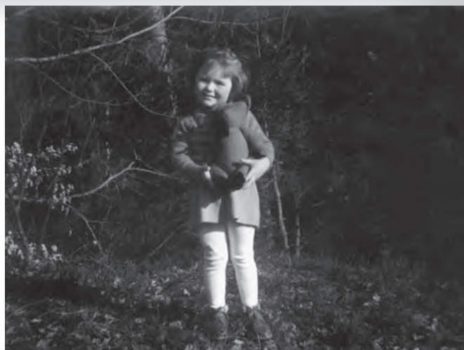
Medvedka sem imela najraje.

jim služili predmeti iz njihove okolice, ki v prvi vrsti niso bili namenjeni igri, a so jih otroci prilagodili svojim potrebam, burili domišljijo in se z njimi igrali. Med te improvizirane igrače so sodile palice in drugi leseni predmeti, ostanki blaga, kamni, veje, blato, voda, trave ipd. Uporabiti so znali tudi tedanje embalažo, kot so bile sredi 20. stoletja na primer kartonaste škatle za čevlje, pločevinke loščila za čevlje, vžigalične škatlice, kolesca za sukanec, ukrivljene deske od lesenih sodov, kovinski trakovi zabojnikov ipd. Iz predmetov, najdenih v naravi in svoji okolici, so izdelovali tudi glasbila, ki so jih tako ali drugače uporabljali pri svoji igri.