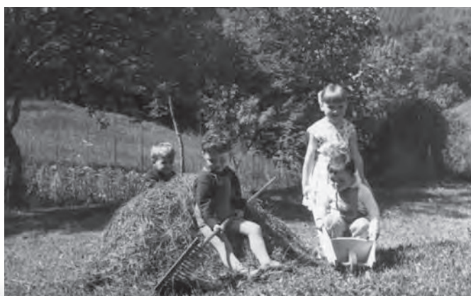
Pomoč staršem je bila dobrodošla.