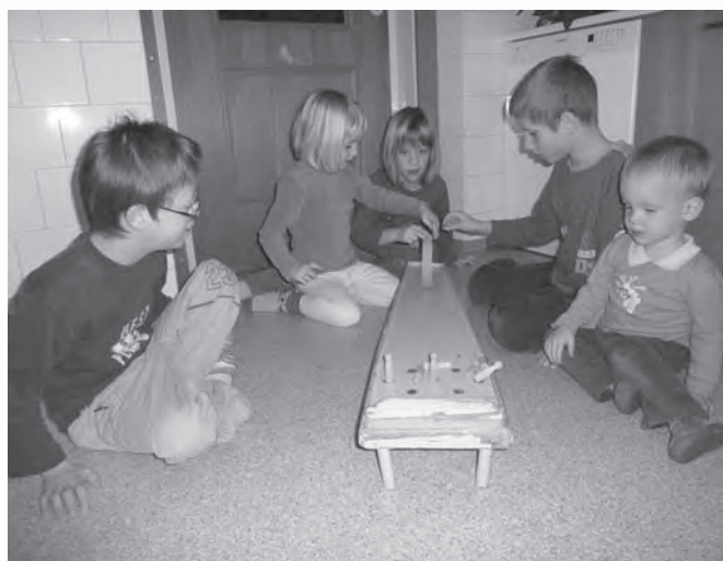
Leseno kegljišče, ki so ga otroci po podrtju razstave spet oživili.

Frnikule smo pri igri ali pridobivali ali izgubljali. Velikokrat smo se sprli. Frnikule smo delali tudi iz blatnih kupčkov, ko jih naredijo deževniki. Te so nam hitro razpadle.»