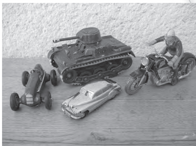
Vozila, izdelana v ameriških oporiščih v Nemčiji po 2. svetovni vojni, za otroke vojakov in uslužbencev.

»Igrače mi je nosil oče. Kupoval jih je v Ljubljani. Ker sem imela veliko igrač, so k meni hodile prijateljice in sošolke, da smo se skupaj igrale. Rade smo se enačile s svojimi mamami, zato