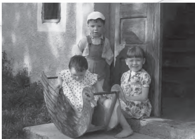
V rački je bilo prostora za vse.