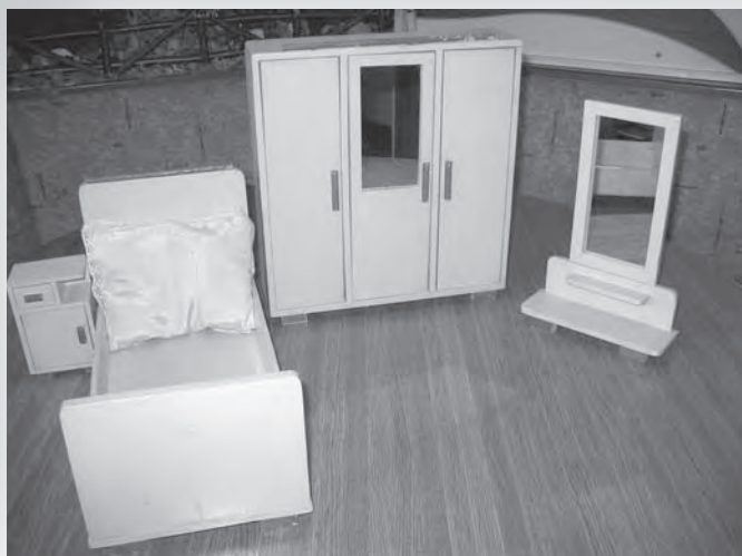
Spalnica za igro.