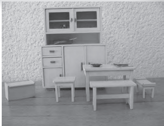
Igralna kuhinja. Kot se spominja Dragica Markun, je imela podobno tudi njena mama.