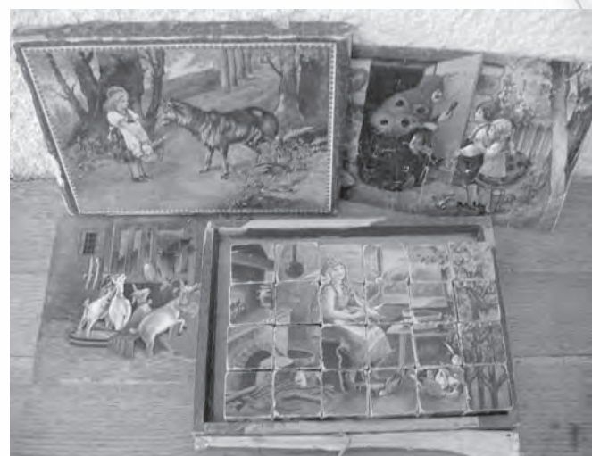
Kocke za sestavljanje.

»Veliko igrač nismo imeli, ker smo živeli na podeželju in nismo bili premožni. Spomnim se prve punčke iz cunj. Iz ostankov cunj nam jo je naredila šivilja, ki je prišla k nam v štero. Plišastega medvedka mi je prinesla botra. Ti dve igrači sem prenašala sem in tja.