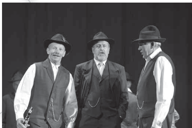
Predstavitve pesmi Ali z onkraj Dravce treh pevcev Folklorne skupine Strmol iz Cerklj pod Krvavcem na srečanju odraslih folklornih skupin Gorenjske.

1991: Izrazi ljudske glasbene teorije na Slovenskem. Traditiones 20, str. 107–114.