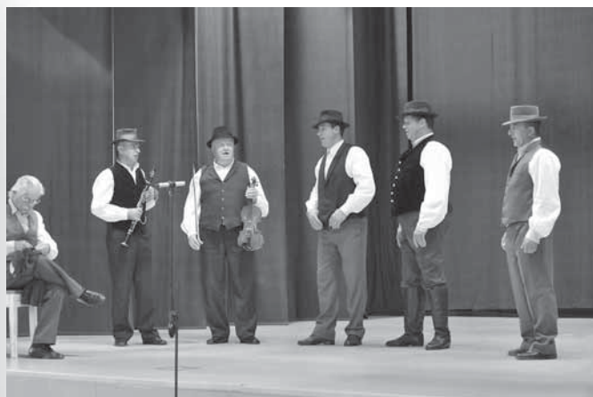
Predstavitve nekdanjega ljudskega petja v izvedbi starejše folklorne skupine Folklornega društva Lancova vas na regijskem srečanju odraslih folklornih skupin.

(Foto: Janez Eržen, Bohinjska Bistrica, 15. 5. 2011.)