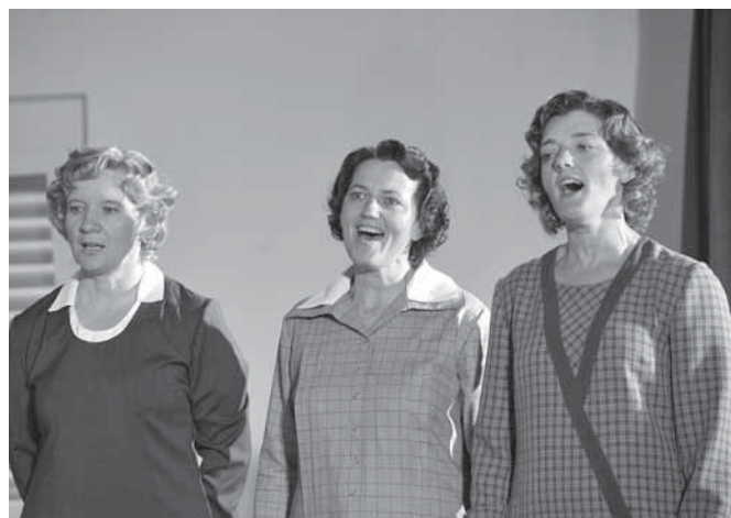
Tri članice Folklorne skupine Kulturnega društva Jakob Sket iz Mestinj na regijskem srečanju odraslih folklornih skupin.

(Foto: Janez Eržen, Cirkovce, 5. 6. 2011.)