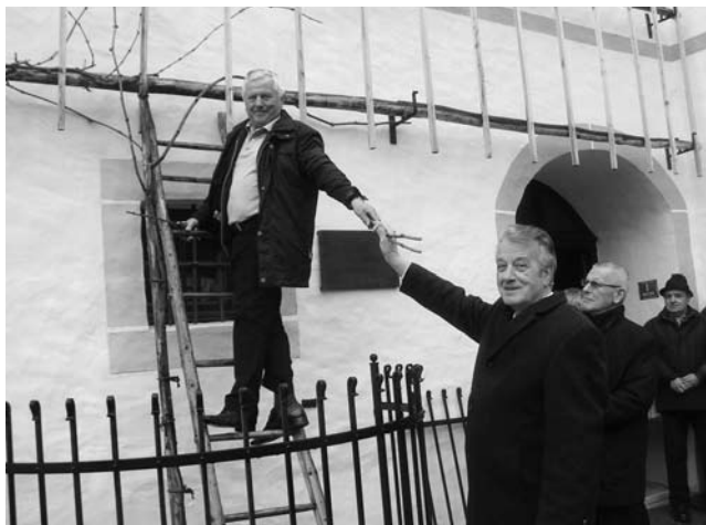
Rez trte v Breznu.

Župnijsko dvorišče Brezno. Rez trte v Breznu. V Občini Podvelka od leta 2010 raste potomka najstarejše vinske trte z mariborskega Lenta. Na Gregorjevo bo prireditelj ob rezu potomke Stare trte na župnijskem dvorišču v Breznu. Program: 10.30 – sveta maša, 11.30 – začetek prireditve Rez trte, ki jo bo spremljal kulturni program in blagoslov dvorišča. Na stojnicah se bodo predstavili nosilci različnih dejavnosti s svojimi pridelki, izdelki, promocijskim materialom ... S prireditvijo se bo začela nova vinogradniška sezona v občini Podvelka.