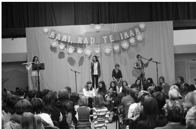
Materinski dan 2013.

Športna dvorana Muta. Prireditev ob materinskem dnevu: Mama – sonce, smeh in sreča. Organizator: OŠ Muta