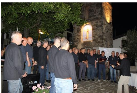
Glasbeni večeri Tabor, 13. 6. 2020

Neporabljena sredstva v višini 3128,00 evra je JSKD nakazal oz. vrnil (9.12.2020) v proračun Mestne občine Nova Gorica. S tem je bil razpis zaključen.