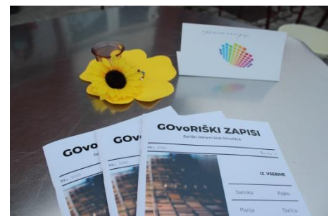
10 let Goriškega lit. kluba Govorica, Mostovna, 16. 10. 2020