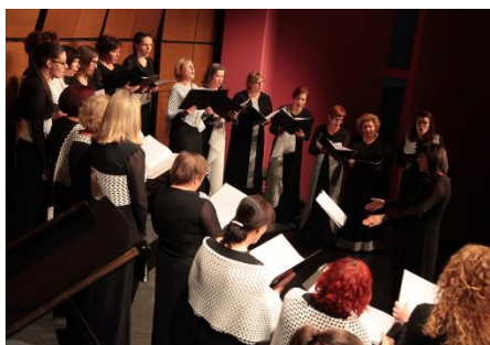
Revija pevskih zborov Goriške

V okviru Severno Primorske koordinacije, ki zajema štiri izpostave (Tolmin, Idrija, Ajdovščina in Nova Gorica) zelo dobro sodelujemo, skupaj izvajamo večje koprodukcijske prireditve in izobraževanja ter drugi regijski program.