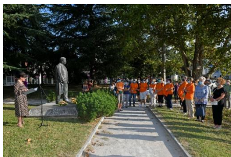
Literarni sprehod Bevk – Šorli, Nova Gorica – Gorica, 19. 9. 2020