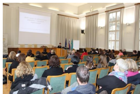
Posvet »Poenostavitev občinskih razpisov«, MONG, 5. marec 2020