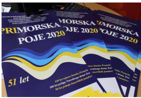
Primorska poje 2020