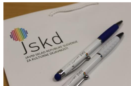
Številni državni, regijski in območni razpisi JSKD