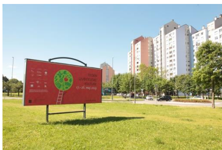
TLK - Teden ljubiteljske kulture

JSKD Nova Gorica nima v upravljanju lastnih prostorov. Z upravljavci kulturnih domov se sprotno dogovarjamo za najem ali soorganizacijo, s katero si zagotovimo popust ali morebitno brezplačno uporabo prostorov.