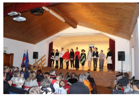
Srečanje otroških gledaliških skupin 2020