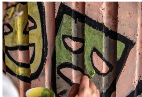
Detajl poslikave v podhodu