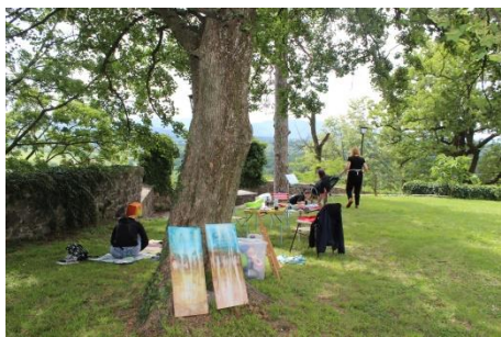
11. Ex-tempore Kromberk