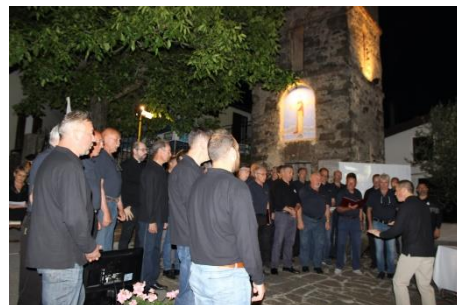
Glasbeni večeri Tabor 2020, Tabor nad Dornberkom, 13. 7. 2020