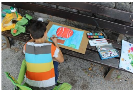
Grad Kromberk, 7. junij 2020