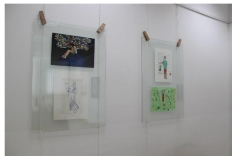
ZKD Nova Gorica, razstava lik. del nastalih na letošnjem Ex tempore, september - december 2020