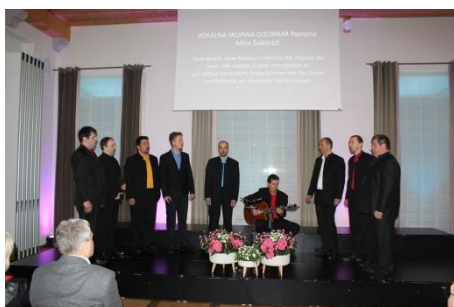
Primorska poje 2020 Vila Vipolže, 28. februar 2020