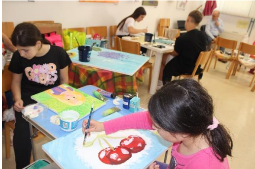
Ex-tempore Kromberk, 4. junij, Točka Zveza kulturnih društev Nova Gorica