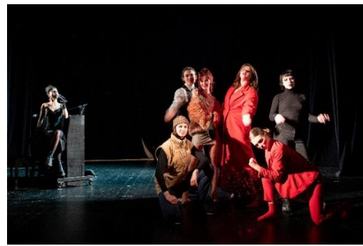
Festival Vizije – Festival mladinske kulture, 19.-21. maj, Nova Gorica