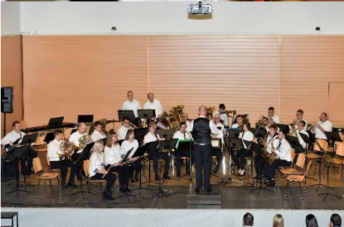
Ta veseli dan kulture 2023: Revija pihalnih orkestrov Goriške, 3. 12. 2023, Kulturni dom Bukovica