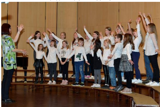
Revija otroških in mladinskih pevskih zborov, 12.-13. april, Kulturni dom Nova Gorica