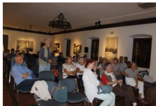
Grad Kromberk, 26. 9. 2023