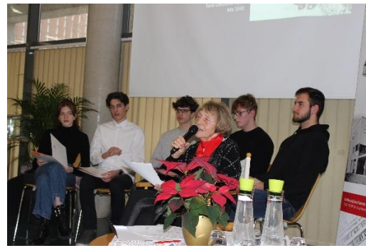
Predavanje o Kajuhu, 20. februar, Goriška knjižnica Franceta Bevka Nova Gorica