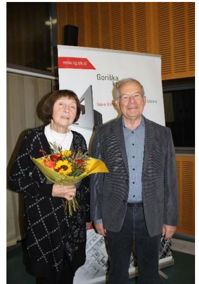
Na poteh z besedo: oblikovanje goriškega prostora.