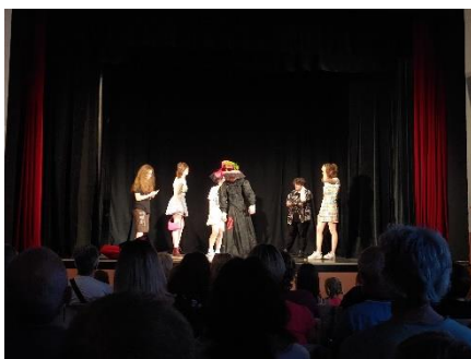
Premiera Mladinskega odra KD Grgar (29. 6. 2023)