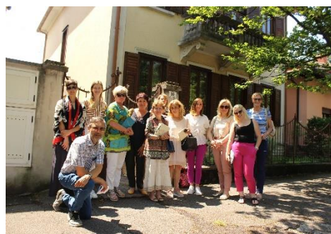
Domačija Šorli-Bratuž Gorica. Obisk kluba parlamentark, 19. 6. 2023