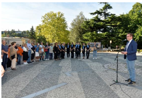
Literarna pokrajina Goriške 2023 4. literarni sprehod (16. 9. 2023)