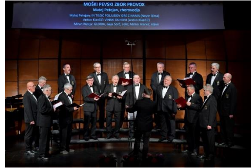
Revija pevskih zborov Goriške, 27.-29. januar, Kulturni dom Deskle