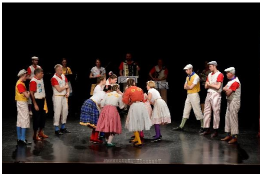
Območno Maroltovo srečanje, 18. marec, Kulturni dom Deskle