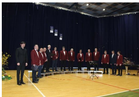
Primorska poje 2023, Bilje, 4. 3. 2023

V okviru Severno Primorske koordinacije, ki zajema štiri izpostave (Tolmin, Idrija, Ajdovščina in Nova Gorica) je utečeno zelo dobro sodelovanje, skupaj se izvajajo večje koprodukcijske prireditve in izobraževanja ter regijski program.