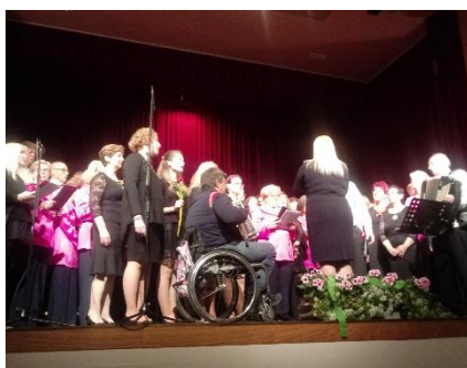
Tradicionalna prireditev, Domovina je ljubezen, Šempas, 22. 4. 2023