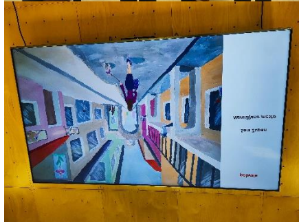
RAVNIKARJEVO leto 2023 Spletna razstava v TIC Nova Gorica in ZKD Nova Gorica