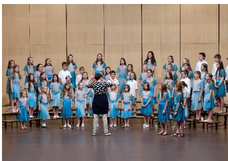
Regijsko tekmovanje otroških in mladinskih pevskih zborov Primorske, Nova Gorica, 30. 5. 2023