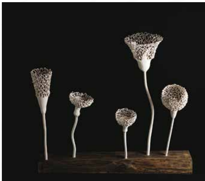
Ana Hanzel, Sežana KRAŠKA GMAJNA _ keramika in les _ 100x30