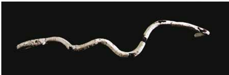
Radovan Gregorčič, Sežana VIZIJA _ keramika _ 100x35