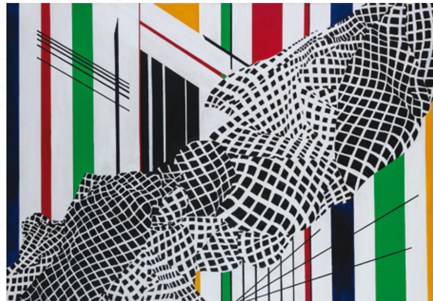
Elizabeth Dodolović, Postojna »VOŽ« _ akril na platno _ 100x70