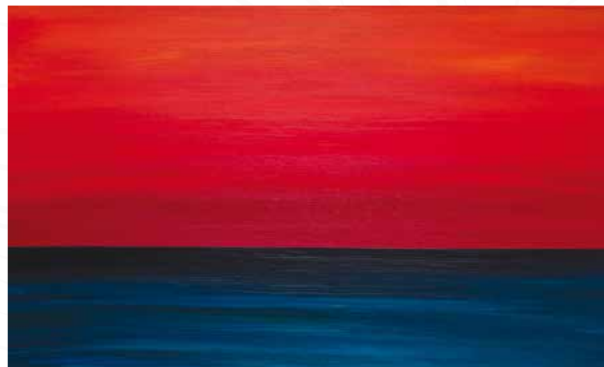
Vesna Jogan, Križ pri Sežani POTEGNEM ČRTO _ akril na platno _ 100x60