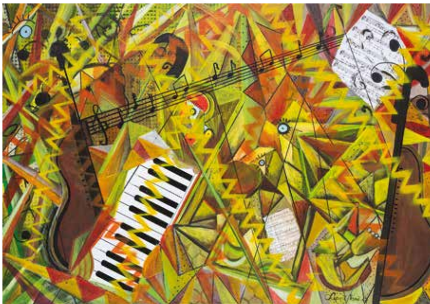
Vanči Lipovž, Postojna NOTNO ČRTOVJE _ mešana tehnika _ 100x70