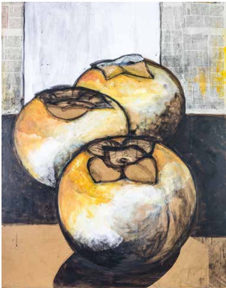
Danjela Bucaj Paradiž, Koper KOMPOZICIJA KAKI _ mešana tehnika _ 100x80