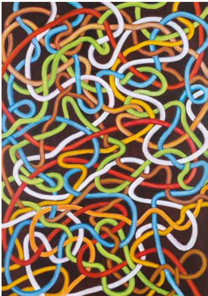
Iva Rebec, Pivka PREPLETENNO _ akril na platno _ 100x70