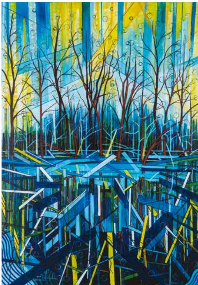
Aleksandra Kovačič, Hruševje »ODSEV« _ akril na platno _ 100x70