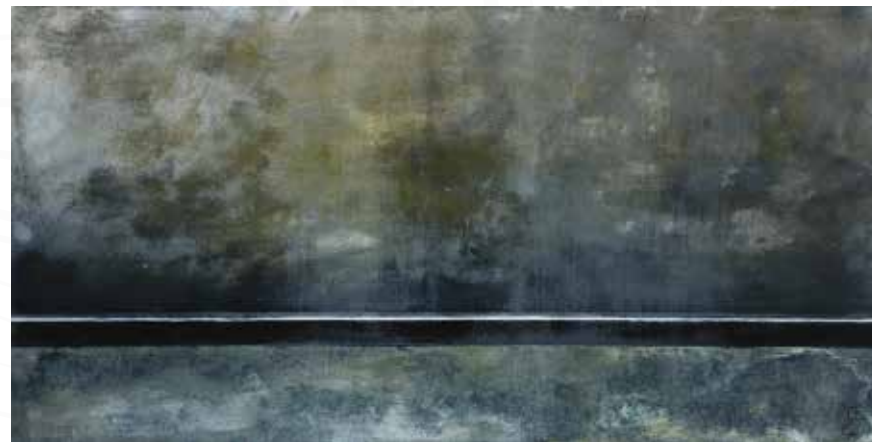
Dajana Čok, Divača PRAVA POT _ akril _ 100x50