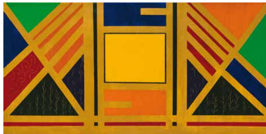
Sonja Peroci, Kopriva »KRAS« VELIKA ČRTA _ akril na platno _ 100x50