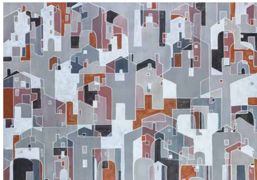
Jana Štok, Sežana VAS _ akril _ 100x70