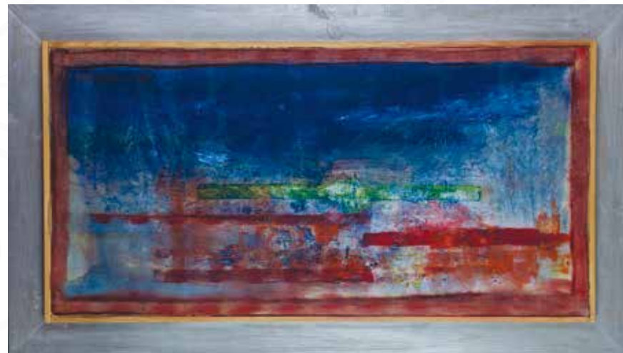
Božica Mihalič, Kozina NA POTI _ akril _ 100x50