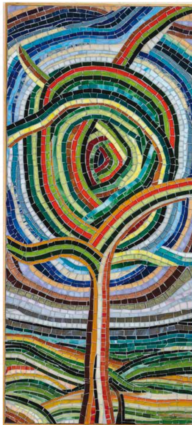
Lidija Leskovšek, Rakek DREVO _ mozaik iz stekla _ 100x45