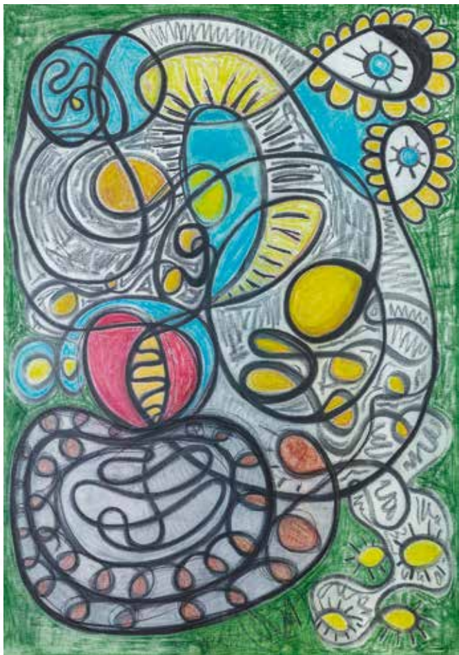
Mojca Tršar, Planina BRSTILNICA _ mešana tehnika _ 100x70