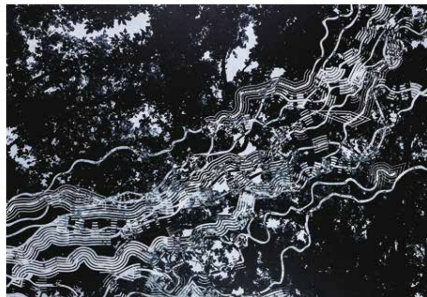
Gaja Hanzel, Sežana SVETLOBA _ mešana tehnika _ 100x70