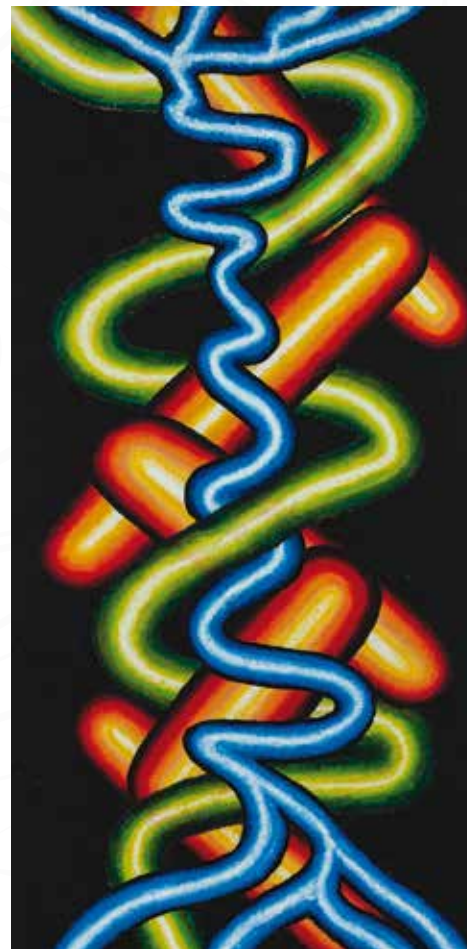
Slavko Guštin, Sežana ČRTA »Ž« _ olje na platno _ 100x50