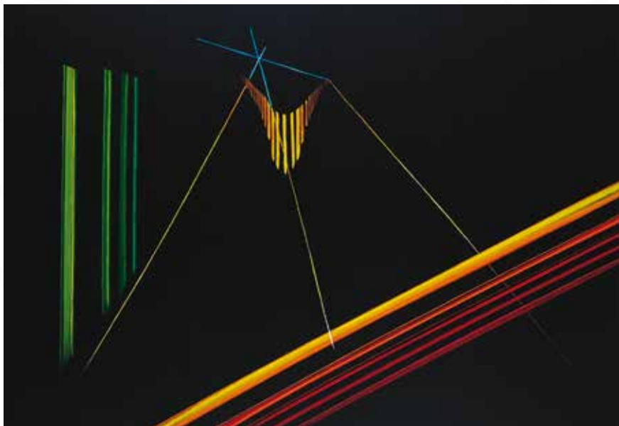
Stanislava Vodopivec, Dutovlje XŽAREK _ akril na platno _ 100x70