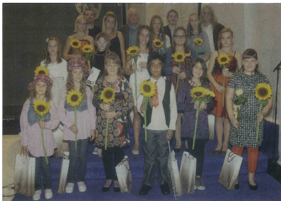
Finalisti lanske Brinjevke s komisijo in organizatorji