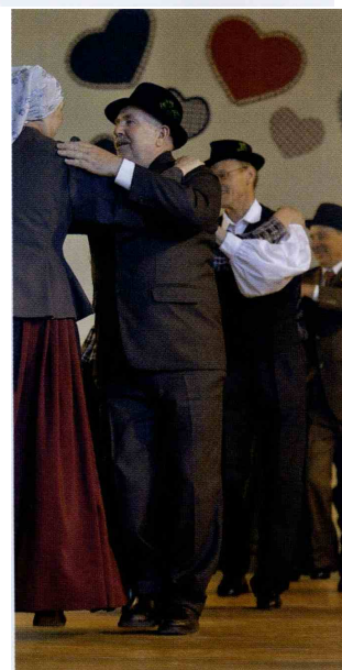
Blagovčani so najstarejša skupina, plešejo pa kot v najboljših letih.