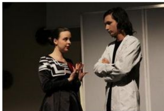
Predstava Perspektive , za katere je scenarij gledališka skupina Lokal Patronir, se ukvarja s problematiko jeze kot neželene značajske lastnosti, s katero se posameznik poskuša spopasti in jo nadzorovati.