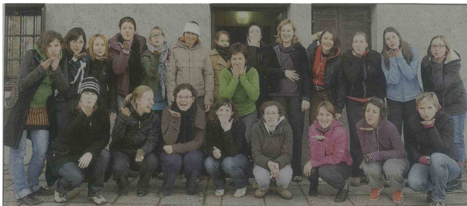
Grudnove Šmikle, sproščene pred mariborskim nastopom, so se na Naši pesmi izkazale z zlato plaketo in četrtem mestom.