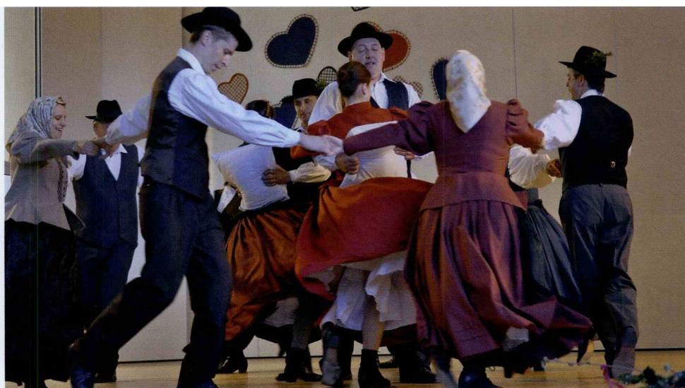
Šentjurski folkloristi so se najbolj vrteli.