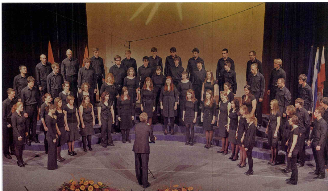
Zbor Megaron sestavljajo nekdanji dijaki Škofijske klasične gimnazije. Nastopili bodo tudi na koncertu zborov Zavoda sv. Stanislava v Cankarjevem domu 13. maja (več v Kažipotu).