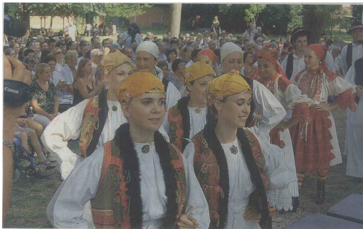
Med gostujočimi skupinami iz tujine so letos bili tudi člani Folklorne skupine Ogranak, Seljačka sloga Buševca iz Hrvaške.