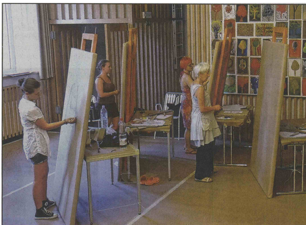
V ateljeju Marof