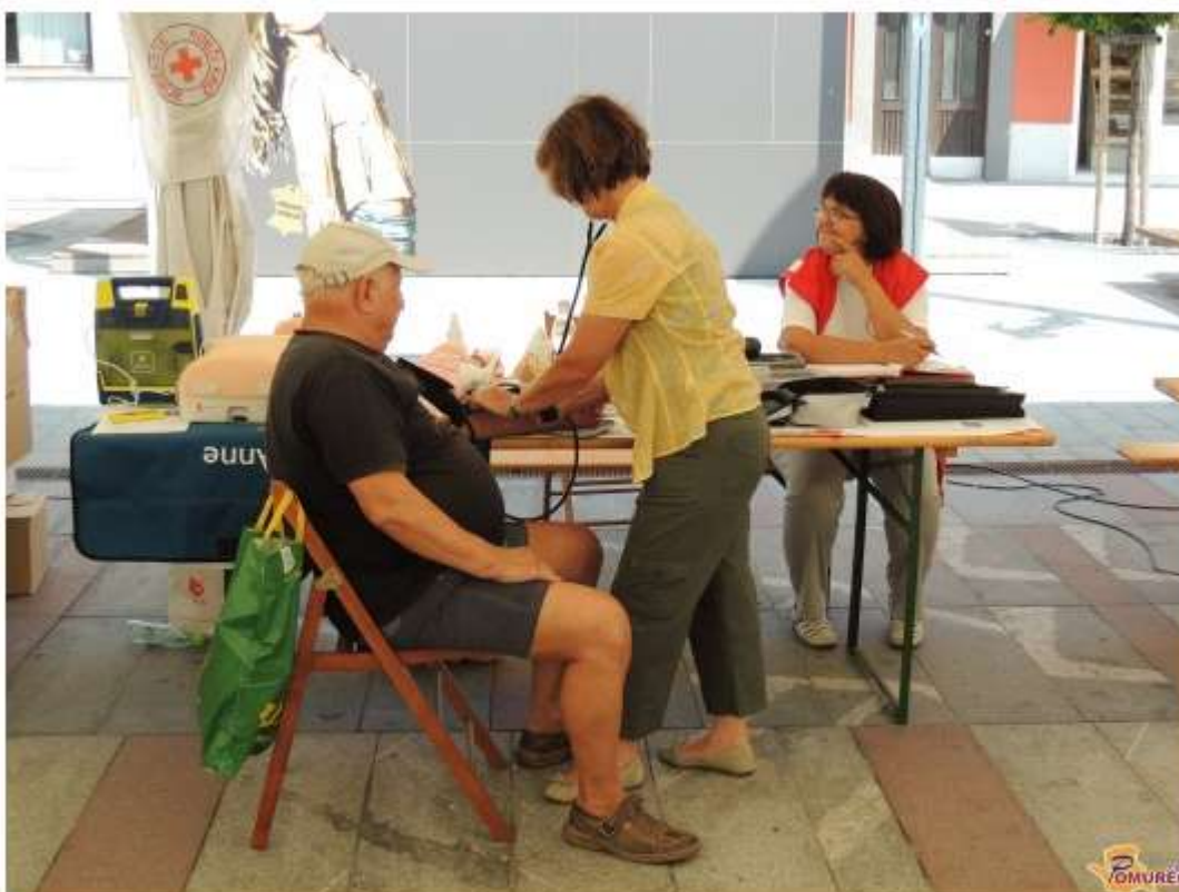
Več fotografij v spodnji galeriji ...