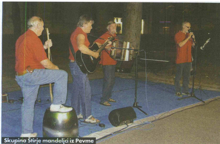
Skupina Štirje mandeljci iz Pevme