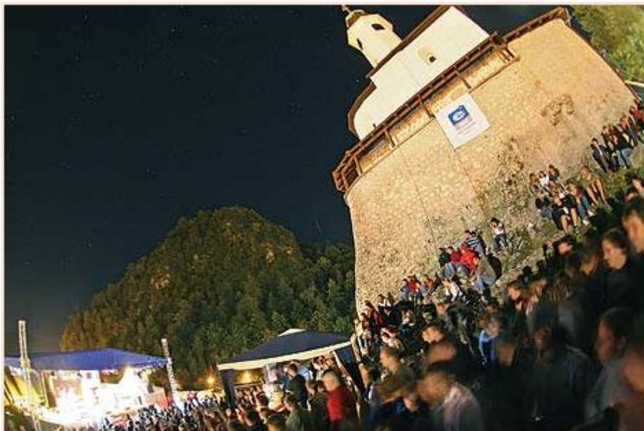
Vselej dobro obiskan

Vsi dogodki festivala bodo brezplačni, kar omogočajo številni sponzorji, kamniška občina, ministrstvo za izobraževanje, znanost, kulturo in šport, Študentska organizacije Univerze v Ljubljani ter Javni sklad RS za kulturne dejavnosti.