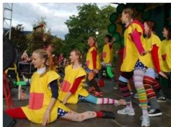
V Velenju je ta vikend moč videti ne le ene, temveč več Pik Nogavičk.