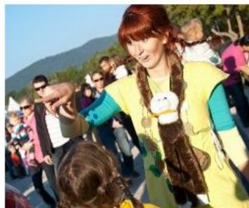
Pika Nogavička je junakinja zgodb, ki so nastale pod peresom švedske pisateljice Astrid Lindgren.