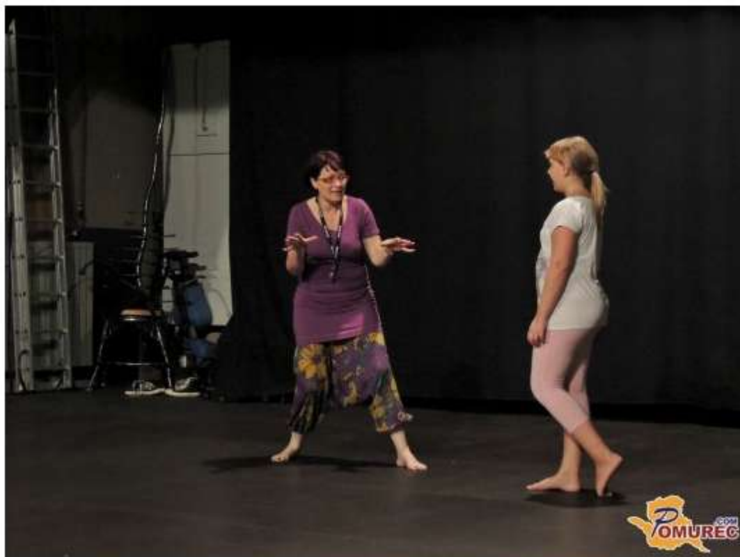
Več fotografij v spodnji galeriji ...