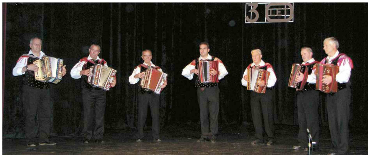
Harmonikarski orkester Kulturnega društva Prežihovega Voranca Ravne na Koroškem (Andreja Čibron Kodrin)

Harmonikarski orkester Kulturnega društva Prežihovega Voranca z Raven na Koroškem je praznoval 30-letnico delovanja