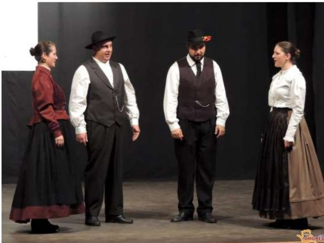
Več fotografij najdete v spodnji galeriji...