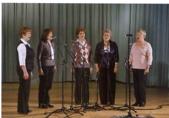
Območno izpostavo JSKD Slovenske Konjice so zastopale Pevke z Dobrave.