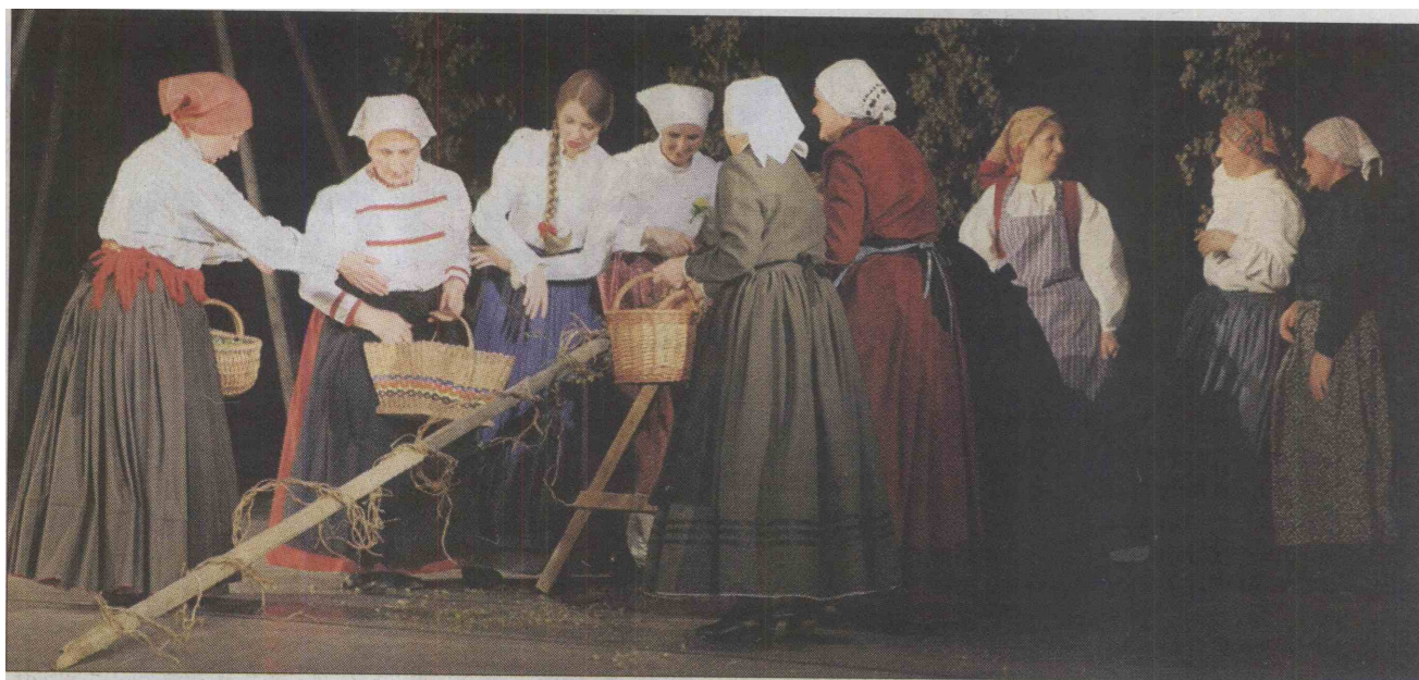
Poleg petja in plesa so se člani Folklorne skupine Grifon na slavnostnem petkovem koncertu v Domu II. slovenskega tabora v Žalcu obudili stare običaje povezane z obiranjem hmelja.