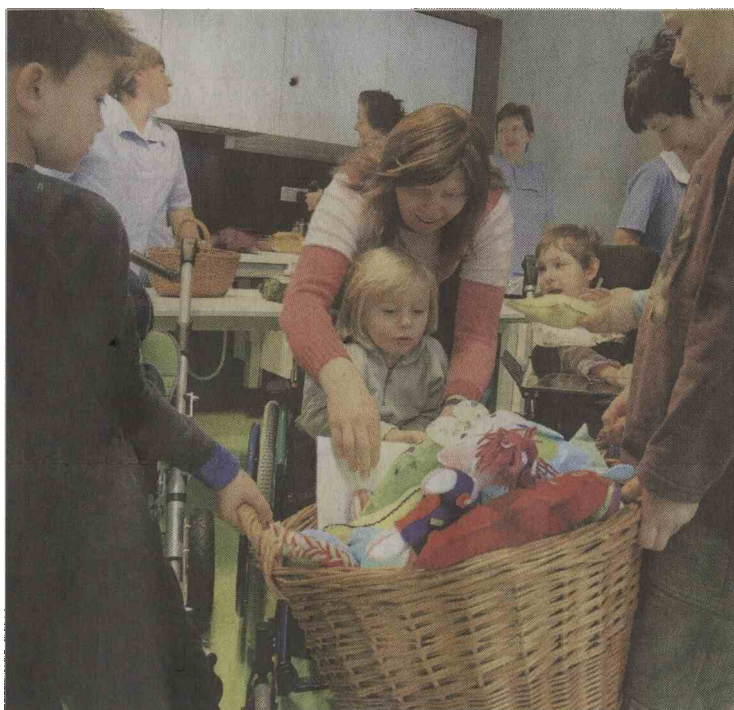
Kdo pravi, da le dobri možje nosijo koše daril?