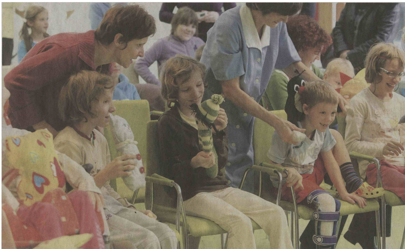
Včeraj je na oddelku Marjetica v Rehabilitacijskem inštitutu Soča vladalo veselje, dišalo pa je po prijateljstvu in otroški radosti.