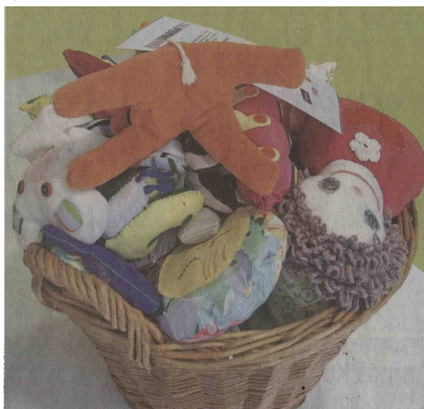
Otroci so iz starih cunj izdelali punčke, sončke, škratke in še kaj.