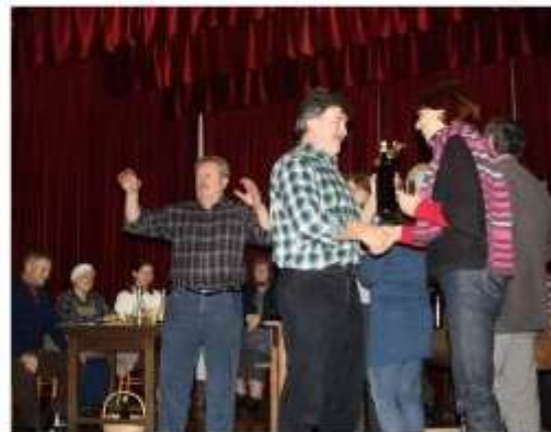
Kapelski pubje so tudi tokrat poskrbeli, da je bil na odru veselo.