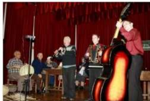
Tudi instrumentalistom je šlo v nedeljo dobro od rok.