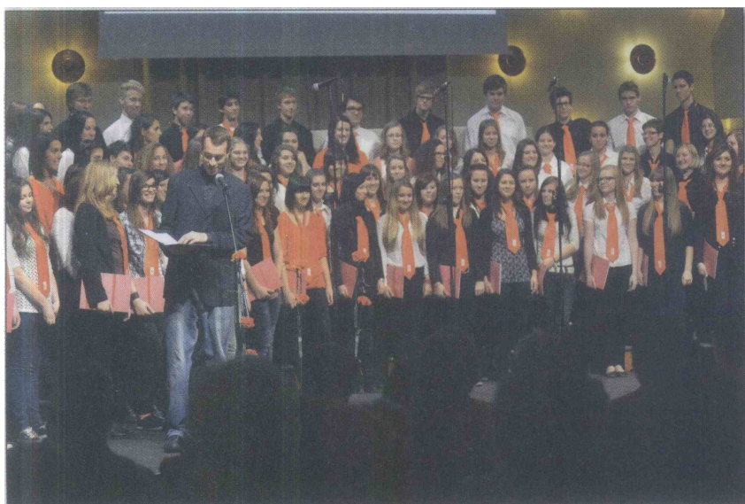
Mešani mladinski pevski zbor Gimnazije Frana Miklošiča iz Ljutomer

do mene, so mi govorili, kako so preseščeni, da smo si drznili narediti tak film, da je odlično narejen in da si želijo, da bi film videlo čim več ljudi. Priznam pa, da me je kot Ljubljančana prizadelo to, da dvorana ni bila polna.«