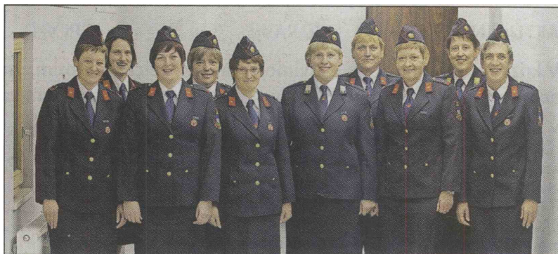
Članice Prostovoljnega gasilskega društva Križe