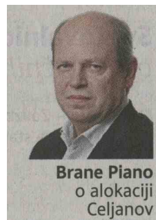
Brane Piano o alokaciji Celjanov