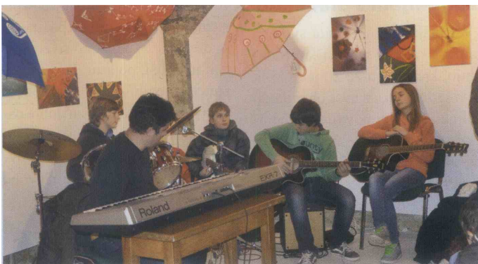
Razstavo so s kulturnim programom polepšali učenci osnovne šole Planina pri Sevnici

bo izkupiček iz te akcije prišel v Galeriji Zgornji trg na ogled do prave roke,“ je dejala. Razstava bo 18. decembra. (Vz.T.)