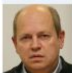
Brane Piano, Celje