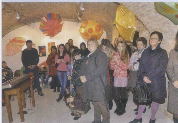
V pisanih dežnikih je vsak našel navdih zase.