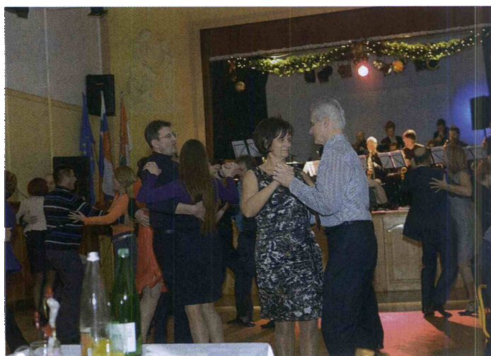
Zavrtelo se je 21 plesnih parov.