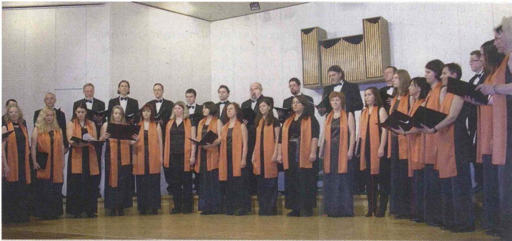
Mešani pevski zbor Postojna z dirigentom na prednovoletnem koncertu v postojnski glasbeni šoli