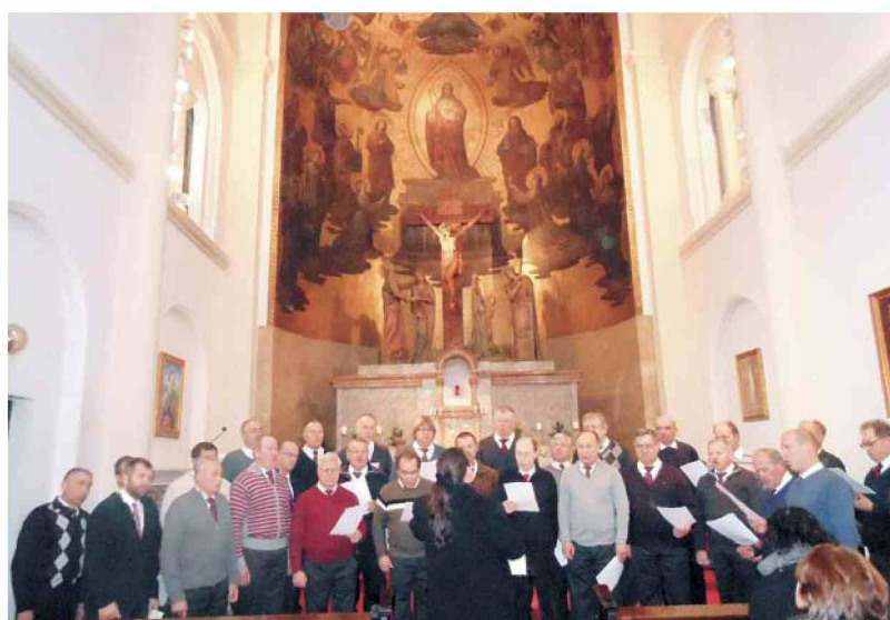
Moški pevski zbor Franceta Prešerna Vojnik je letos pel na Dunaju.