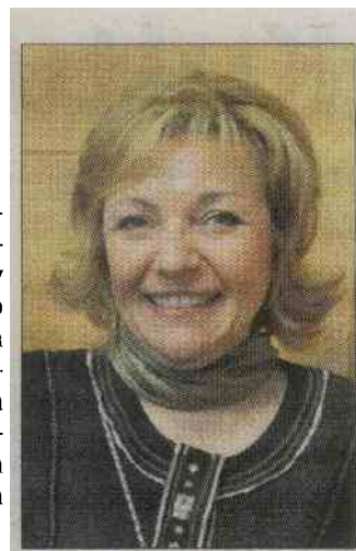
StO, foto: G. GOBEC

Kar pa se tiče dela javnega sklada za kulturne dejavnosti, to pod krinko varčevanja pomeni še manj možnosti za dialog, za dogovor o različnih projektih. Zagotovo ne bo ob tem nič manj birokratov, ker ti sami sebe pač nikoli ne ukinjajo. Se pa bodo dobri in zanimivi projekti. Nekateri namigi že govorijo o krčenju sredstev na tem področju. Še slabše pa je, da o določenih zadevah na ministrstvu že zdaj nismo našli kooperativnega sogovornika, zdaj pa bo še toliko slabše.«