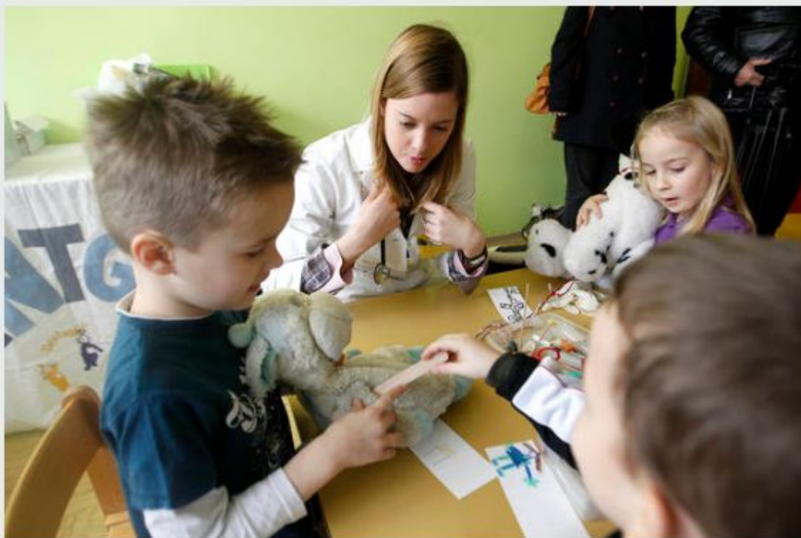
Otroci bodo ustvarjali v različnih delavnicah.