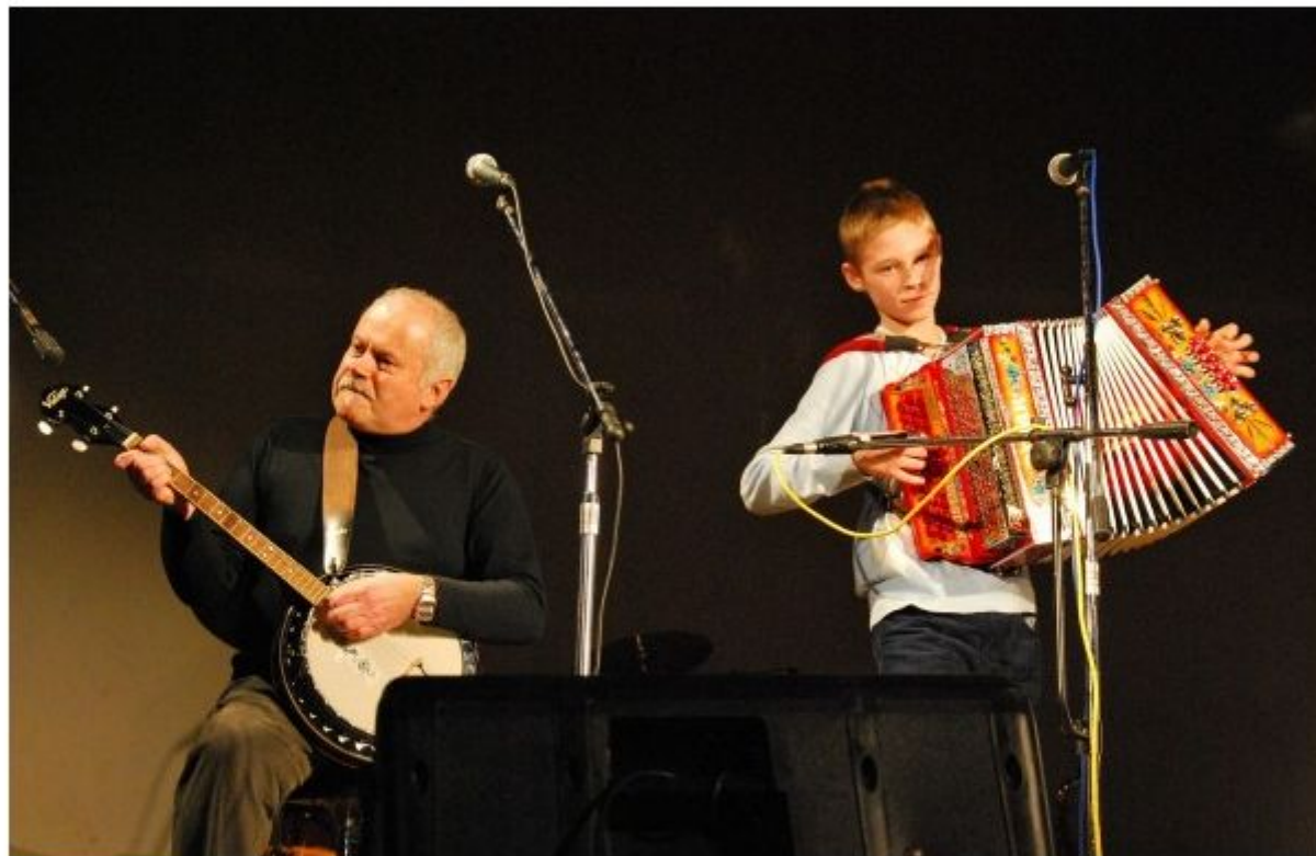
Letos je prvič nastopila skupina Mašin mački.