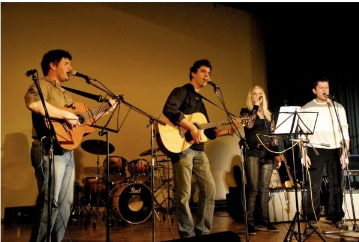
Kvartet Zmrm žejni je zafušal do konca.

Na festivalu Dajmo malo fušat se že vrsto let predstavljajo belokranjske zasedbe, ki se zavedajo, da je pot v vrh glasbene scene posuta s trnjem. Prvič so začeli fušati natanko 3. decembra 2004. Doslej je na festivalih nastopilo že okrog 500 izvajalcev. Prireditelj doslej še nikomur ni bila odskočna deska, da bi se prerinil med vidnejše slovenske glasbenike in to se verjetno tudi nikoli ne bo zgodilo.