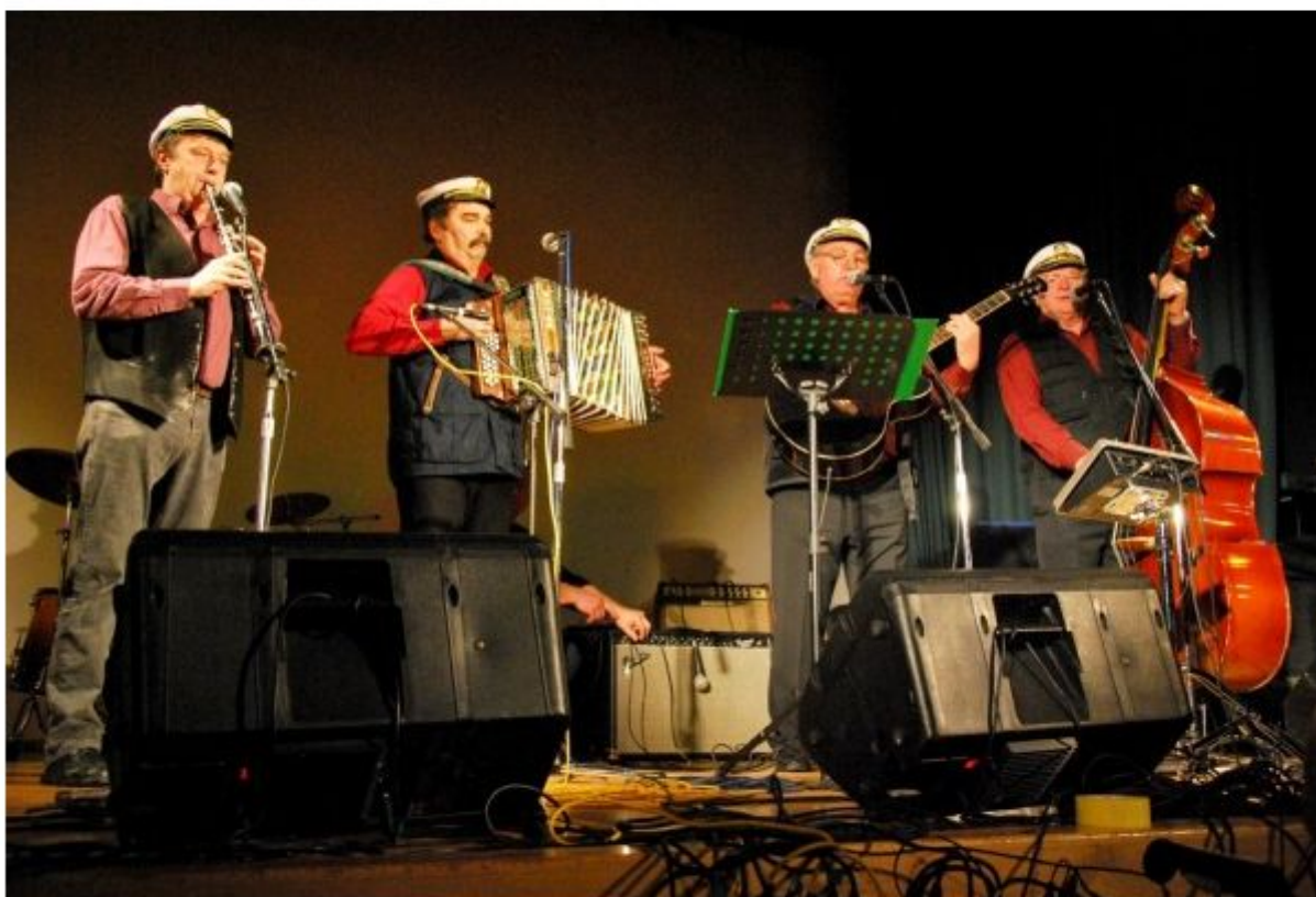
Mladi upi, ki ubrano fušajo, so nastopili na vseh osmih festivalih.

Povsod po Sloveniji pripravljajo festivale, na katerih glasbeniki pokažejo vse svoje znanje in virtuoznost. Kaj pa tisti resnično amaterski neprofitni izvajalci? Kje se lahko predstavijo takšni? V Metliki so že osmo leto zapored pripravili festival z imenom Dajmo malo fušat.