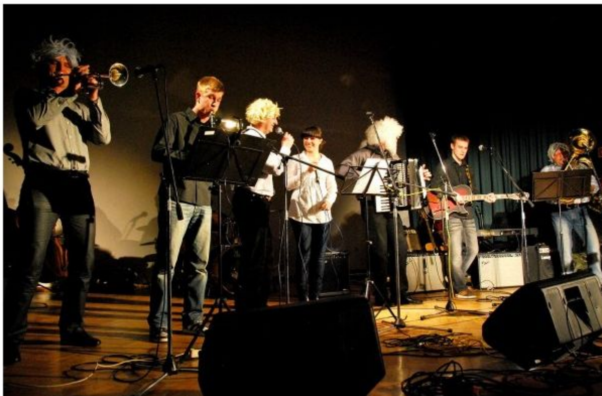
Skupino Po glavi obriti so sestavili člani Mestne godbe Metlika.

Organizatorji so že večkrat razmišljali, da bi izvajalce, ki ne fušajo, kaznovali. Sicer pa poskušajo že v začetku izločiti tiste, ki bi radi pokazali, kar znajo in ne, kar ne znajo. Uveljavljeni belokranjski narodnozabavni ansambel Vasovalci bi zelo rad nastopil, vendar se morajo temeljito poslabšati, če želijo priti na fušanje. Zaenkrat jim dovolijo le, da poskrbijo za ozvočenje in se učijo od nastopajočih.