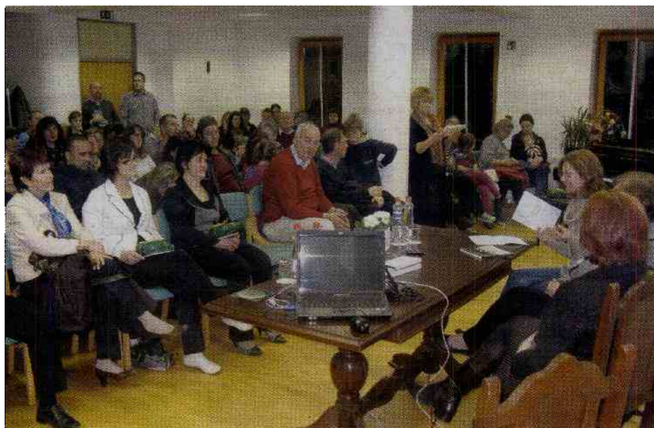
Na osrednjem delu so predstavili bogato čtivo v beneškem narečju

Včeraj je prireditev sklenilo Beneško gledališče s predstavo Mož naše žene . AS