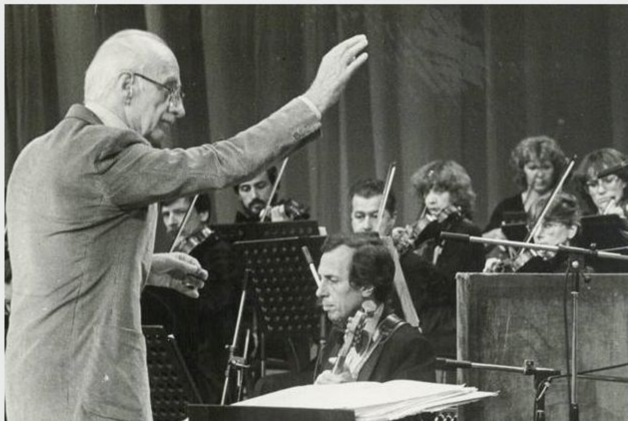
Bojan Adamič

Ljubljana - Leto 2012 bo v Sloveniji v znamenju Bojana Adamiča. Minilo bo namreč 100 let od njegovega rojstva. Na enega največjih slovenskih povojnih glasbenikov, ki se je ukvarjal tudi s fotografijo, bodo tekom leta opozarjali številni koncerti in prireditve. Del projekta bo vključen v okvir Evropske prestolnice kulture.