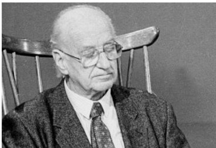
Bojan Adamič.

LJUBLJANA - Leto 2012 bo v Sloveniji v znamenju Bojana Adamiča. Minilo bo namreč 100 let od njegovega rojstva. Na enega največjih slovenskih povojnih glasbenikov, ki se je ukvarjal tudi s fotografijo, bodo tekom leta opozarjali številni koncerti in prireditve. Del projekta bo vključen v okvir Evropske prestolnice kulture.