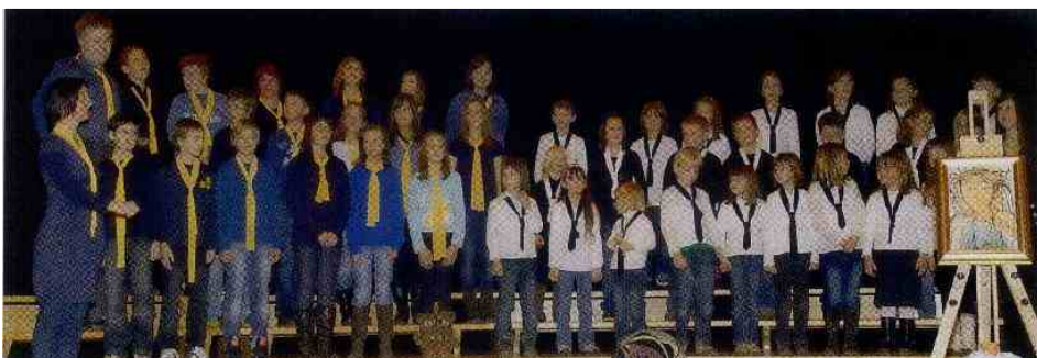
Izbrane pesmi sta skupaj zapela otroški in mladinski cerkveni pevski zbor