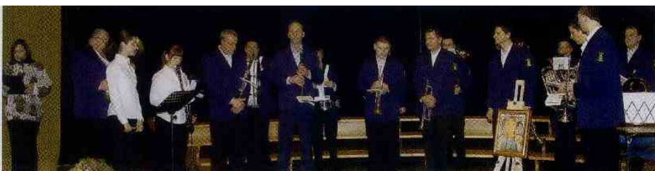
Uvod v dobrodelni koncert so zaigrali glasbeniki Pihalne godbe Steklarna.