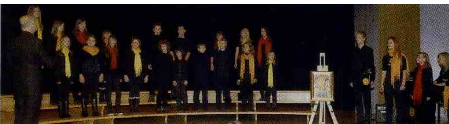
Toplo sprejeta izvedba Snežne noči, skupina Sled.