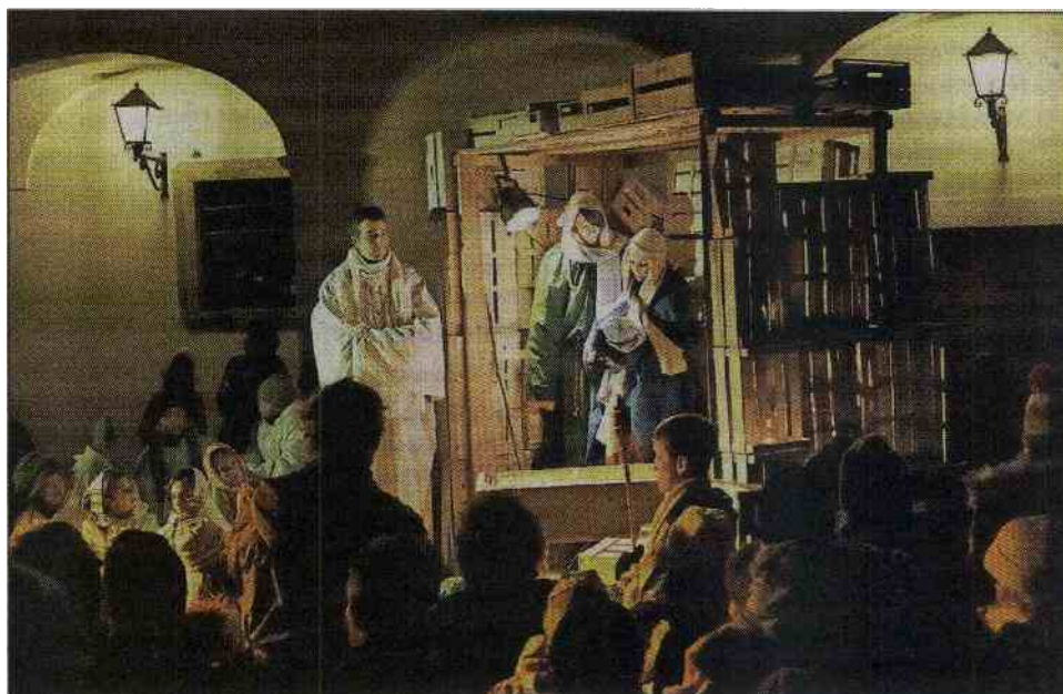
Linhartov trg je bi na božični dan premajhen za vse, ki so si prišli pogledat žive jaslice.

Tako so se zaključile letošnje božično-novoletne prireditve, s katerim želi zavod Turizem Radovljica v prazničnem času oživiti staro mestno jedro in dati domačinom možnost, da v prijetno okrašenem trgu nakupijo darilca, se družijo in zabavajo. Sejem, ki se je začel 16. decembra, je postregel z nastopom radovljiškega raperja Alena, otroško delavnico, boljšjakom, prikazom kova-