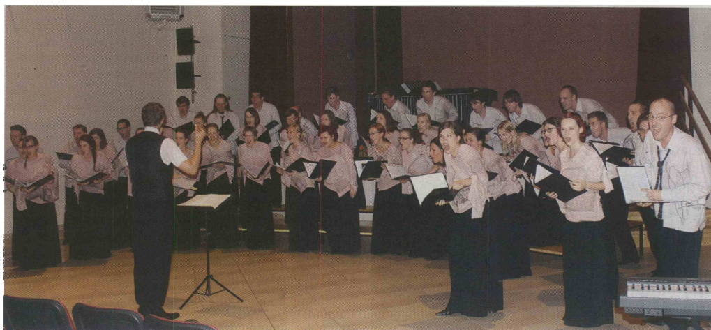
V Šempasu so konec tedna gostili prvega od znanih zborov, APZ, ki bodo prihajali na cikel pevskih srečanj

Tudi v nadaljevanju ciklusa (od jeseni dalje) bodo Zborovska srečanja Šempas ponujala nastope uveljavljenih skupin, prepoznavnih v Sloveniji in na tujem.