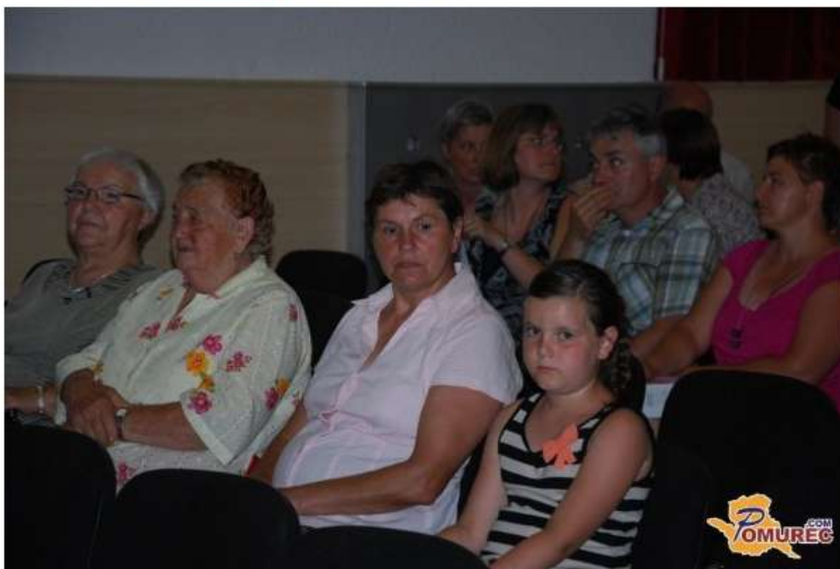
Več fotografij v spodnji galeriji...