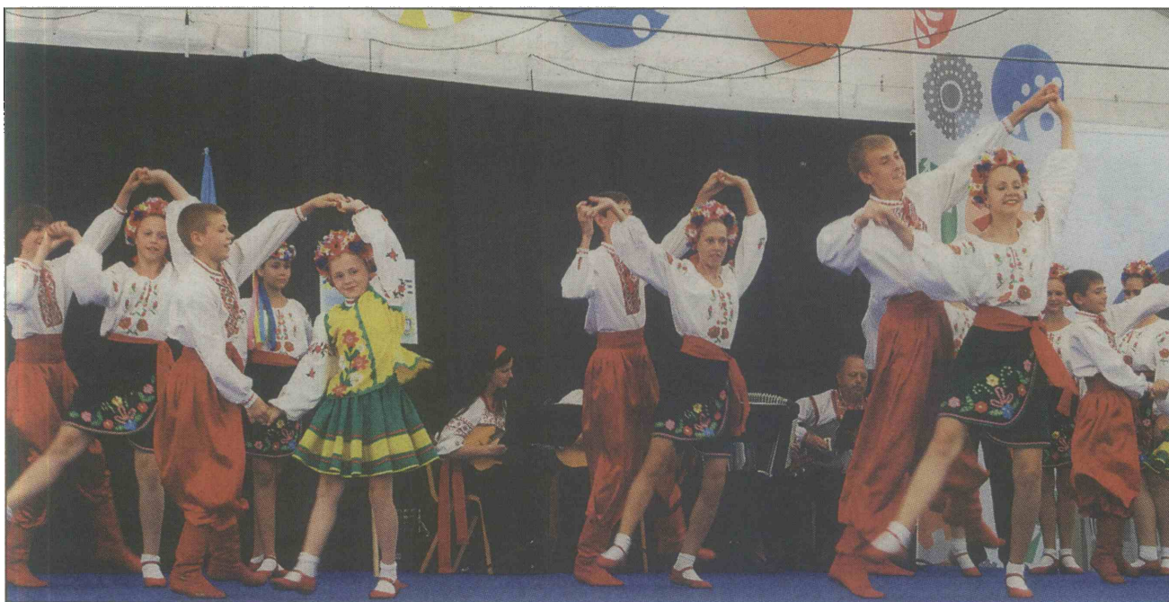
Nastopajoči so pripravili zanimive programe (na posnetku), najštevilčnejša publika pa so bili nastopajoči in malčki iz Vrta Ptuj.