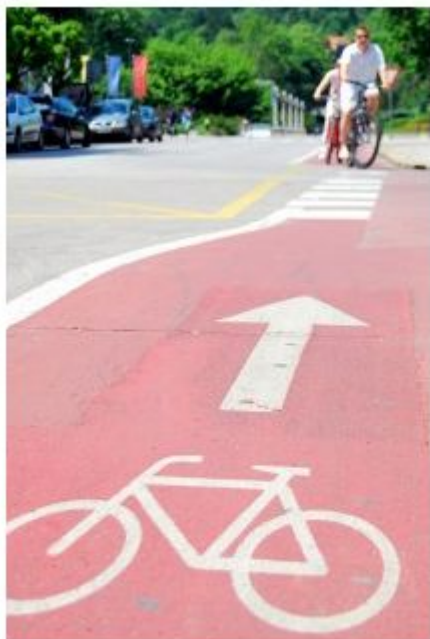
Med najbolj pogostimi prekrški, ki jih storijo kolesarji, je tudi vožnja po napačni strani kolesarske steze.

Policisti pravijo, da prepletanje različnih udeležencev na isti prometni površini seveda ni optimalno, tako da je na podobnih površinah potrebna še večja previdnost in strpnost. Na PU Ljubljana so sicer poudarili, da imajo na območjih za pešce in območjih umirjenega prometa pešci vedno prednost pred drugimi udeleženci cestnega prometa. "Promet kolesarjev je sicer dovoljen, vozniki pa morajo voziti posebno previdno tako, da ne ogrožajo pešcev," so dodali.