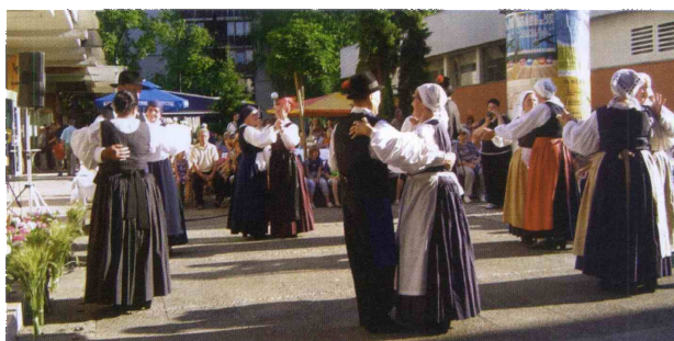
Folklorna skupina MČ Slavka Šlandra je skupaj z gosti krajanom priredila nepozaben večer.

Mestna četrt (MČ) Slavka Šlandra je dokaj urejen in