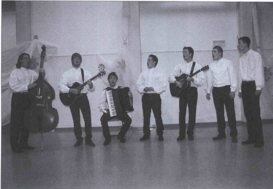
Rečiški pobi so se tokrat predstavili tudi z dalmatinskimi pesmimi.

Zadnji četrtek v juniju so v rečiški osnovni šoli obiskovalci uživali v petju malih vokalnih skupin. Na koncertu z naslovom Odmev z gora so se Rečičanom predstavile vokalne skupine Ingenium in Gallina iz Ljubljane ter Rečiški pobi.