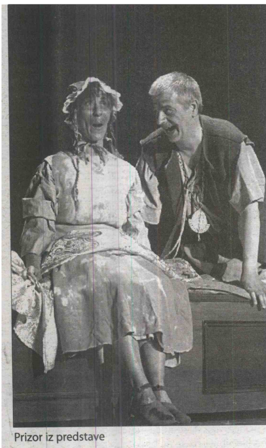
Prizor iz predstave

Da je predstava res kakovostna bodo lahko potrdili vsi gledalci, ki si jo bodo ogledali 5. avgusta, ko jo bodo uprizorili v Praprotnu v okviru Poletnih večerov pod zvezdami.