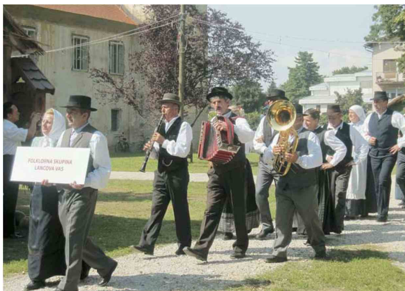
Folklorne skupine so se najprej predstavile z mimohodom.