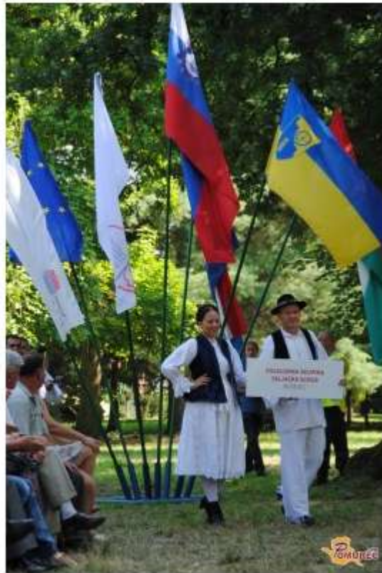
Več fotografij v spodnji galeriji ...