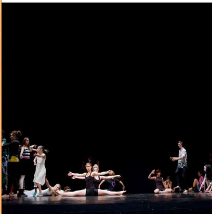
Plesalci so na tekmovanju tudi skupno improvizirali.