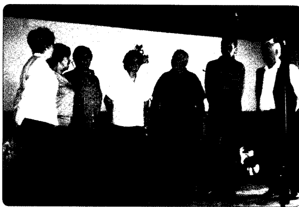
Ljudski pevci KD Dobrina