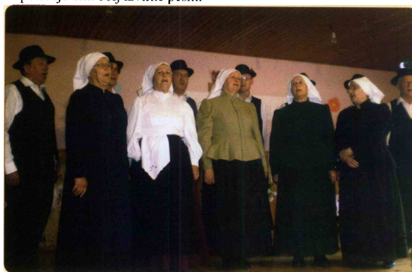
Pevci folklorne skupine Blagovna