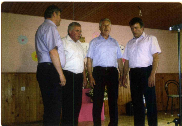
Ljudski pevci iz Dramelj