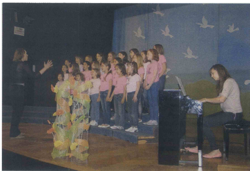
Otroški zbor OŠ Šmarje pri Kopru na nastopu v Ilirski Bistrici