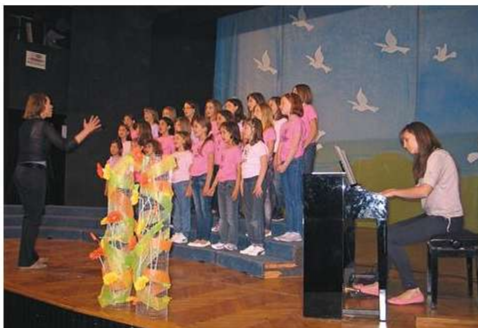
Otroški zbor OŠ Šmarje pri Kopru na nastopu v Ilirski Bistrici

Po gostovanju v Idriji in Desklah se je v Domu na Vidmu iztekla letošnja, že 41. revija otroških in mladinskih pevskih zborov Naša pomlad , na kateri je prepevalo 4027 pevk in pevcev.