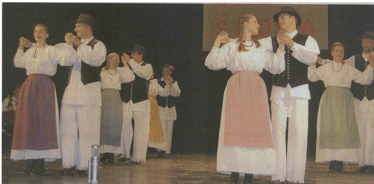
Na regijsko srečanje se je uvrstila tudi Folklorna skupina Kulturno-umetniškega društva Beltinci.