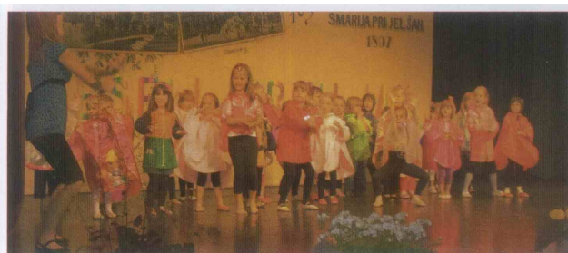
Deževen dan so odplesali otroci iz enote Sonček Šmarje pri Jelšah.