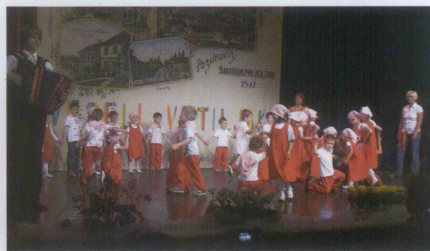
Plesalci ljudskih plesov iz Rogatca s harmonikarjem.