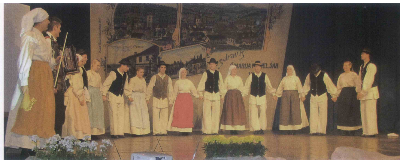
Folklorna skupina Anton Stefanciosa iz Rogatca.