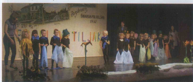
Dan na travniku so predstavili otroci vrtca Podčetrtek.