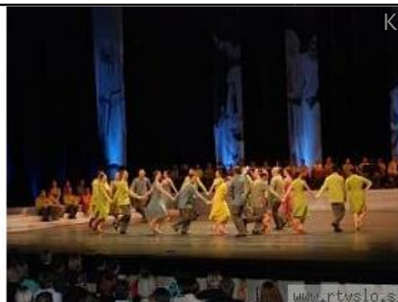
V folklorni dejavnosti so prepoznali najboljšo in najenostavnejšo pot, kako prikazati regionalno raznolikost Slovenije.