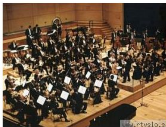
Orkester Slovenske filharmonije bo program začel z izvedbo Slovenskih ljudskih plesov Alojza Srebotnjaka, sklenilo pa se bo z izvedbo evropske himne.