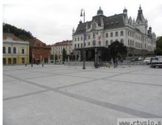
Letošnja državna proslava ob dnevu državnosti bo potekala v petek, 22. junija, na Kongresnem trgu v Ljubljani.