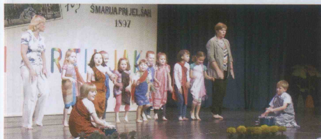
Ples Zulujev so plesali otroci iz Šentvida.