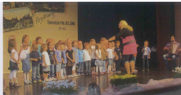
Pevski zbor enote Sonček s Čebelarjem in Čokolino bando.