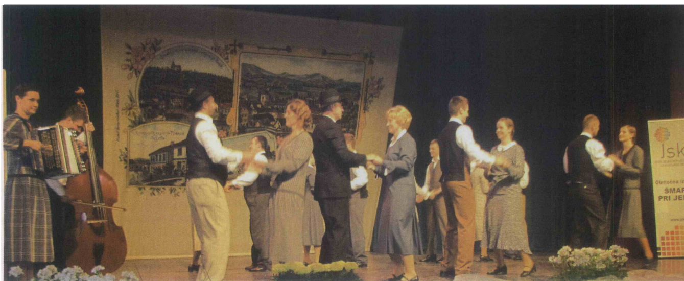
Folklorna skupina Jakob Sket Mestinje.

Na regijskem srečanju odraslih folklornih skupin v Šmarju pri Jelšah je nastopilo osem skupin.