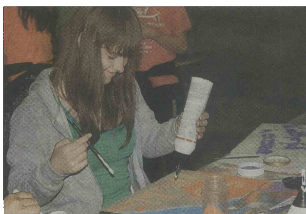
Otroci so bili navdušeni, najbolj jim je bilo vseč ustvarjanje z barvno mivko.