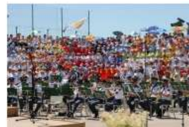
Združeni zbori na lanskoletnem taboru v Šentvidu pri Stični