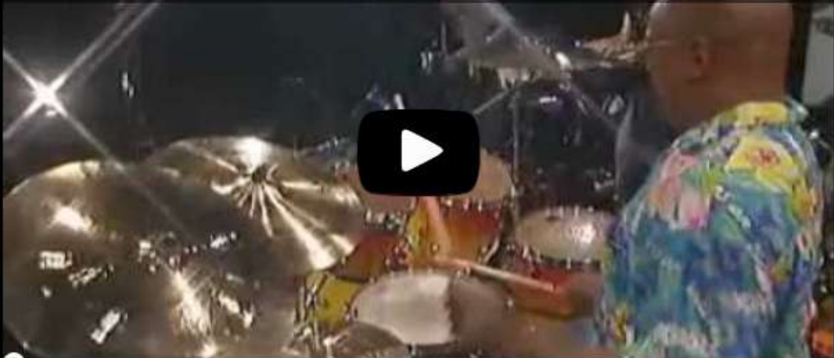
0:00 / 3:45