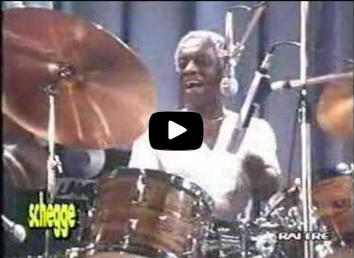
Master Drummer Billy Cobham