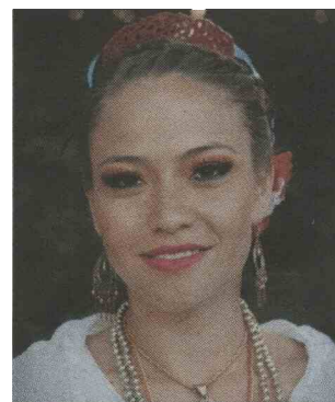
Ne samo večje, ampak tudi lepe plesalke.