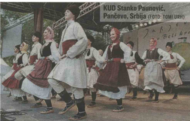
KUD Stanko Paunović, Pančevo, Srbija