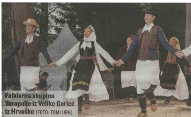
Folklorna skupina Turopolje iz Velike Gorice iz Hrvaške