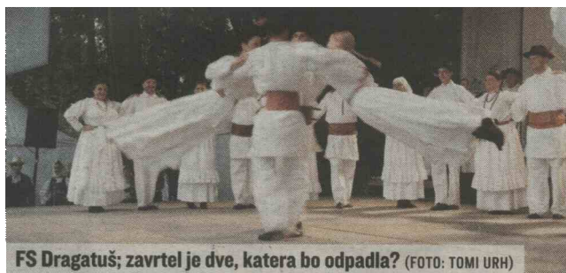
FS Dragatuš; zavrtel je dve, katera bo odpadla?