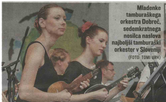
Mladenke tamburaškega orkestra Dobreč, sedemkratnega nosilca naslova najboljši tamburaški orkester v Sloveniji