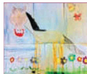
Ziva, 6 let