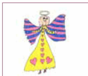
Glorija, 6 let