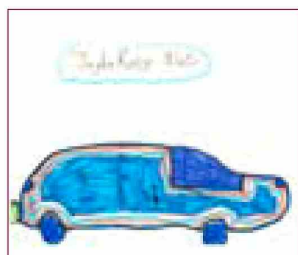
Tajda, 8 let