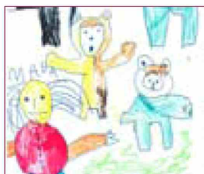
Maja, 5 let