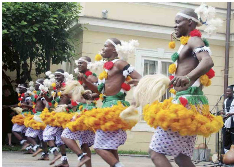
Zanimiv nastop afriške skupine Les As du Benin na vrtu gradu Ravne

Koroško, podobno kot druge predele Slovenije, v teh dneh prežema poletni ritem, ki ga med drugim zaznamuje že osmo Koroško kulturno poletje. Tradicionalni poletni kulturni festival se je v zadnjih letih uveljavil kot skupni regijski festival koroških občin, ki poteka pod okriljem Regionalne razvojne agencije Koroška. Letos v sklopu tega festivala ne sodeluje mestna občina Slovenj Gradec, ki ima kot partnersko mesto EPK samostojni festival Slovenjgraško poletje EPK 2012. Čeprav je odločitev Slovenj Gradca, da se tokrat ne pridruži skupnemu regijskemu projektu, temveč prireja vzporedni festival, zbudila nekaj polemik, je za obiskovalce kulturnih prireditev na koncu ključnega pomena pester nabor dogodkov, ki lahko uživajo poletne dni na različnih prizoriščih. V Koroškem kulturnem poletju tako sodelujejo občine Dravograd, Ravne in Radlje ob Dravi, osrednja prizorišča dogodkov pa so prireditveni prostori v središčih omenjenih občin in na dvoriščih ob gradovih oziroma dvorcih v teh občinah. Kot pojasnjuje pro-