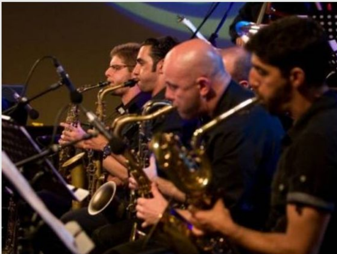
Big band.

Tina Lešničar, kultura pet, 29.06.2012, 09:00