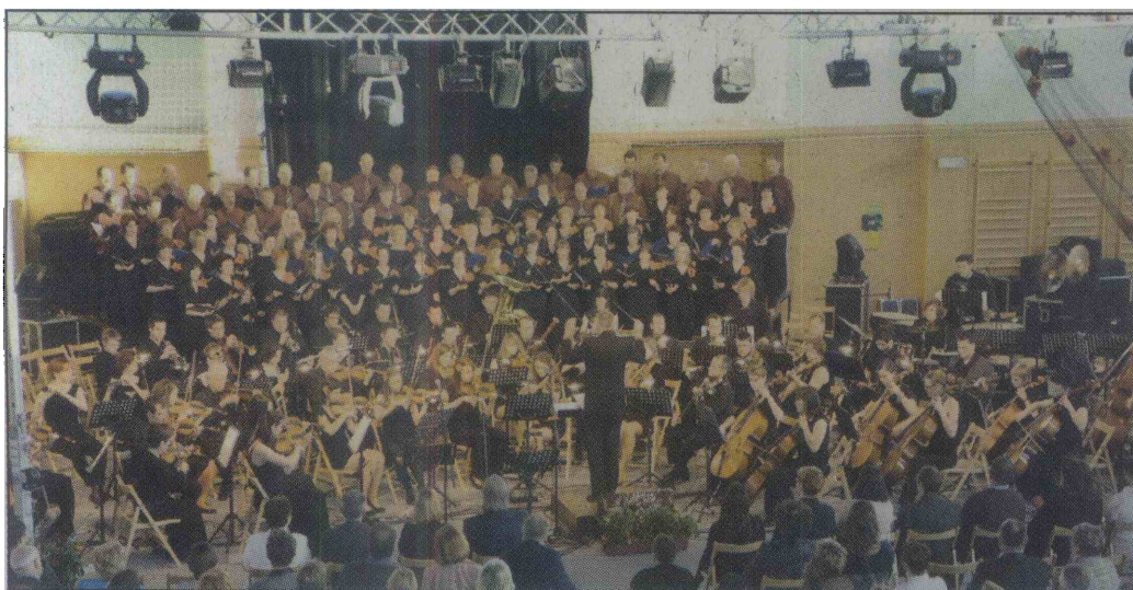
Orkester Simfonika in oba zbora v dvorani OŠ A..M. Slomška