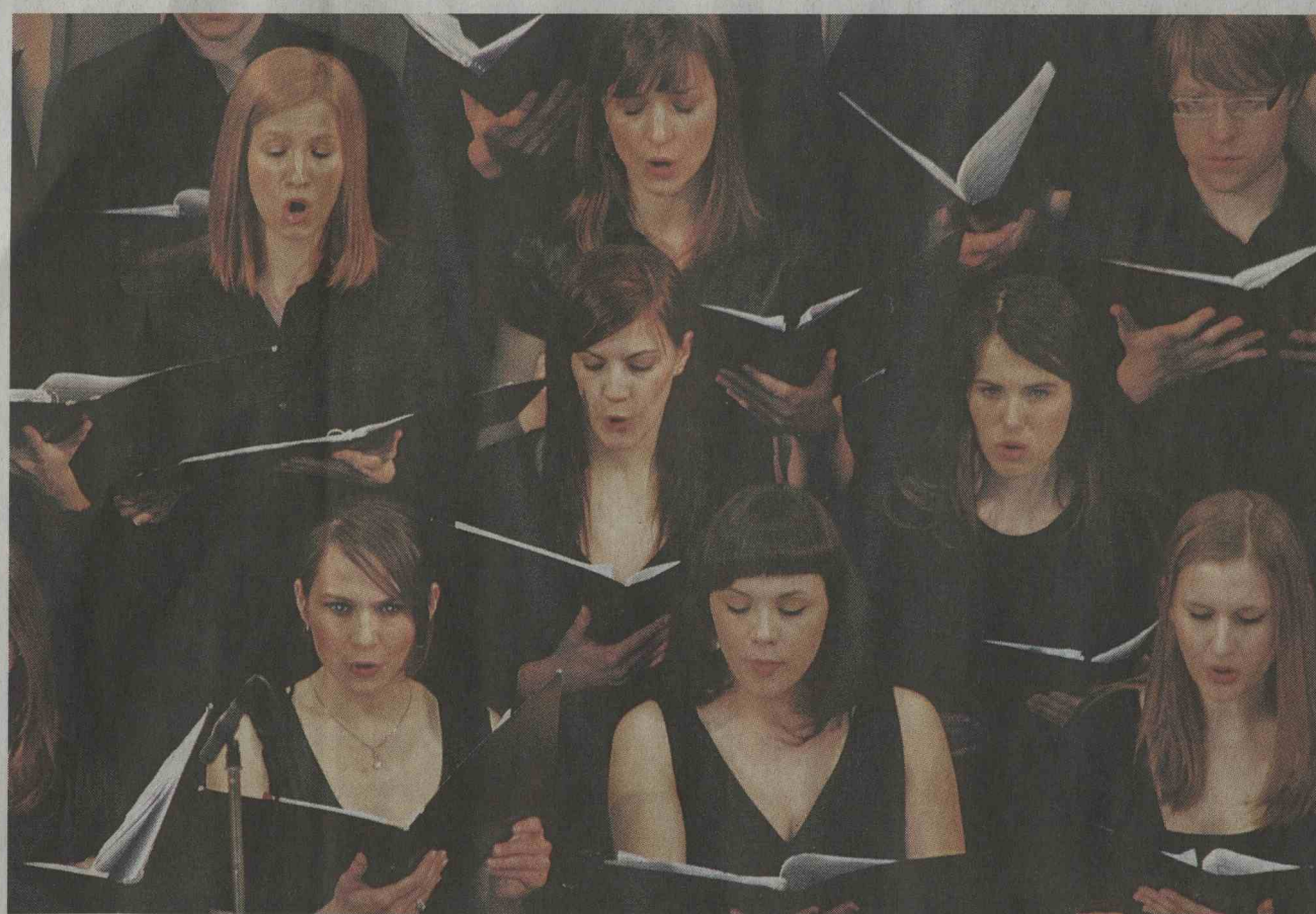
Združena Mešani pevski zbor Obala iz Kopra in Akademski pevski zbor Tone Tomšič iz Ljubljane.