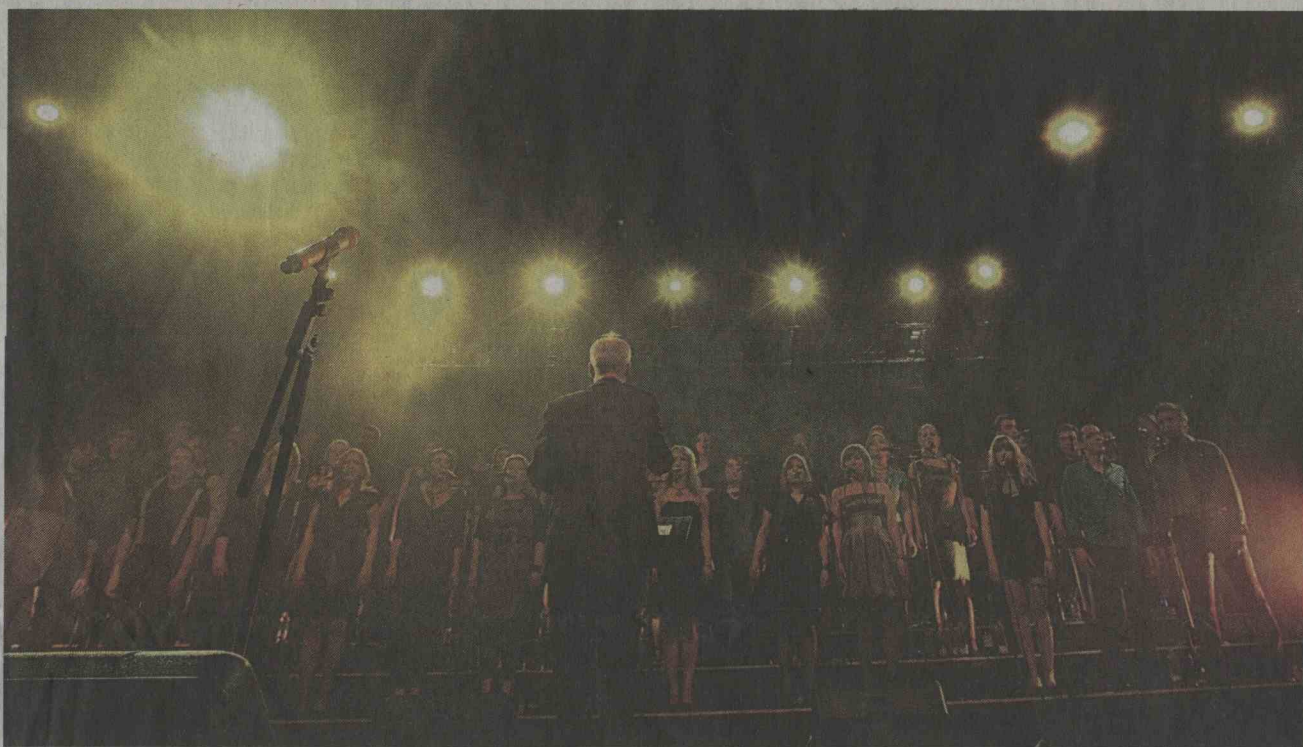
Posebnost je zbor Perpetuum Jazzile, ki med drugim izvaja pop, jazz, funk, bossa novo in gospel.