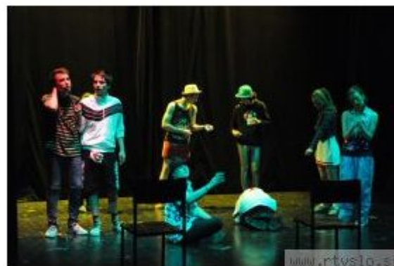
Najboljša gledališka predstava v celoti: Mularija Gledališke šole Prve gimnazije Maribor, je nastala po motivih istoimenskega filma ( Kids ).