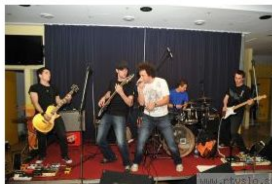
Najboljša mladinska rock skupina, Fireflies iz Škofje Loke. Rock Vizionar jim prinaša snemanje glasbenega videospota.