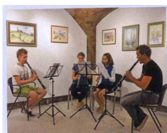
Kvartet klarinetov Clarifun