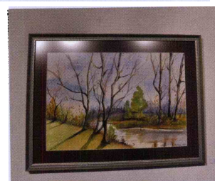
Slikarji so z akvareloom upodobili najrazličnejše motive.

stvu nad opravljenim delom pa so pričali tudi obrazi članov društva. Akvarel je namreč cenjena in zahtevna slikarska tehnika, ki zaradi hitrosti nanosa zahteva veliko vaje in ustvarjalnosti.