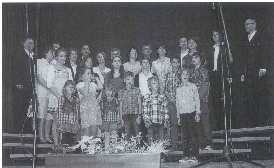
Novost revije odraslih pevcev je bil nastop Družinskega pevskega zbora KD jurij Mozirje.