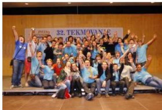
Pihalni orkester Krka je mednarodno priznan in prodoren orkester, ki deluje od leta 1957.