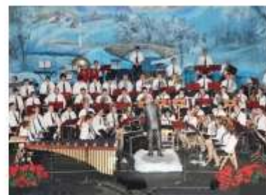
Pihalni orkester Zarja Šoštanj