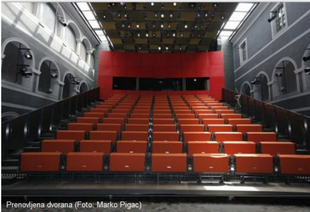
Prenovljena dvorana