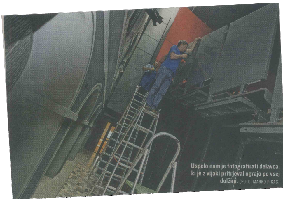
Uspelo nam je fotografirati delavca, ki je z vijaki pritrjeval ograjo po vsej dolžini.