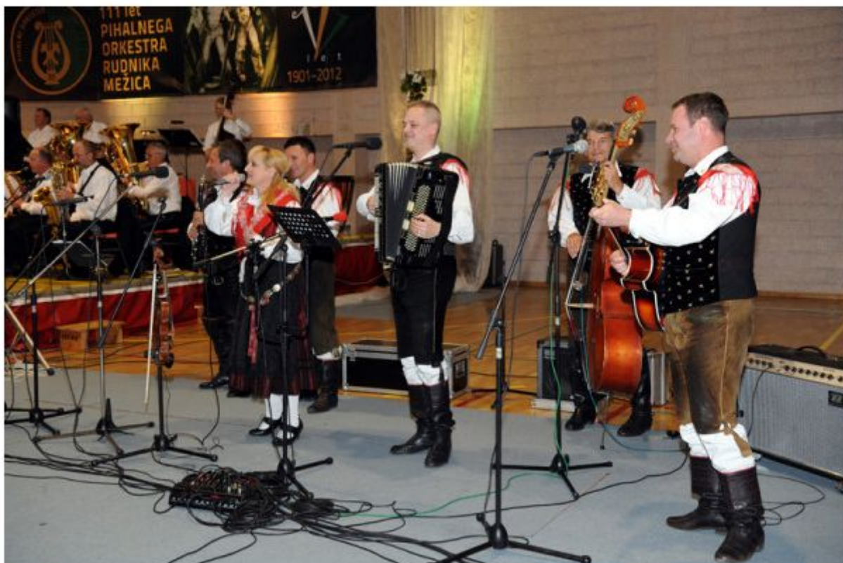
Kot glavni gostje so nastopili člani ansambla Igor in zlati zvoki.