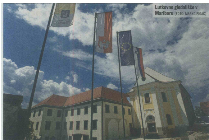
Lutkovno gledališče v Mariboru