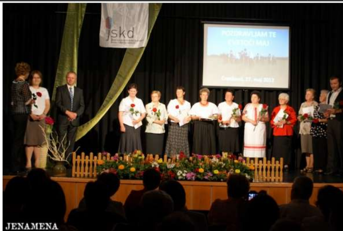
Več fotografij v spodnji galeriji...