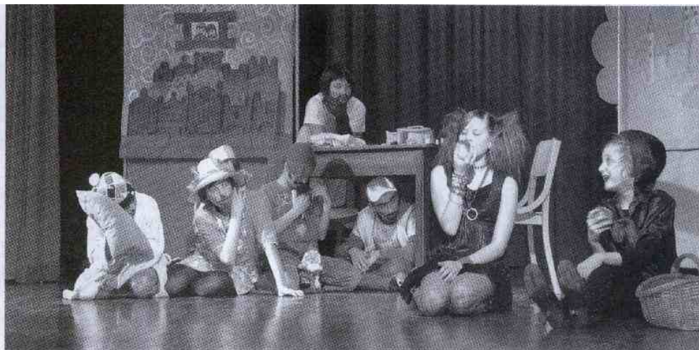
Dramska skupina OŠ Hruševce

si bodo za nagrado lahko ogledale izbrano predstavo na državnem srečanju, ki bo 6. junija v Velenju. (Ve.T.)