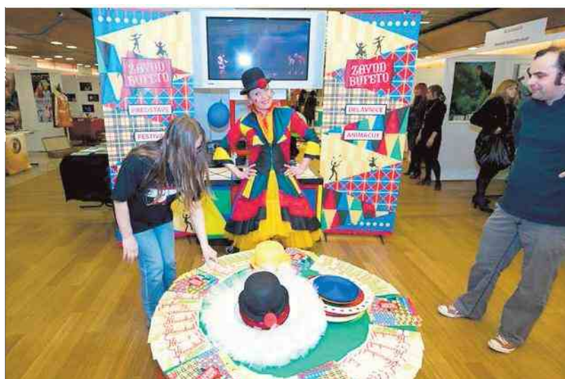
Na Kulturnem bazarju 2012 bo svojo kulturnovzgojno ponudbo za otroke in mladino postavilo na ogled več kot 200 kulturnih ustanov in samostojnih kulturnih ustvarjalcev iz vse Slovenije.