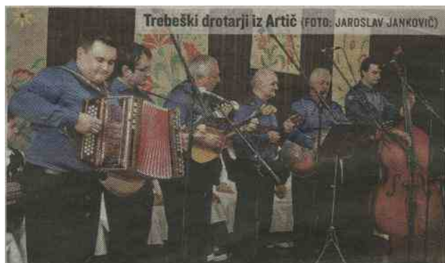
Trebeški drotarji iz Artič