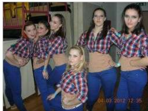
Članska hip hop mala skupina Alter ego