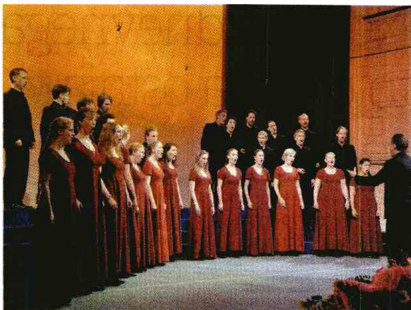
Spored in izvedba švedskega zbora sta presešla dosedanje dosežke na mariborskih tekmovanjih in prepričala žirijo in veliko večino zvestih poslušalcev v dvorani. (Janez Eržen)