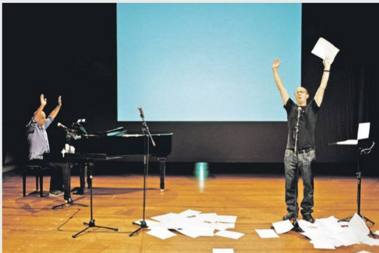
Ceneno predavanje (Cheap Lecture)

Misel o neredu je Burrows zapisal v knjigi Koreografov priročnik (2010), ki temelji na oblikovno razdrobljenem in navidezno nedoslednem principu. Prav takem, v kakršnega nas avtor pogosto vpelje tudi v odskih dogodkih. Dva izmed njih – Ceneno predavanje in Kravji komad – sta bila predstavljena na štiridnevem dogodku Mišljenje koreografije .