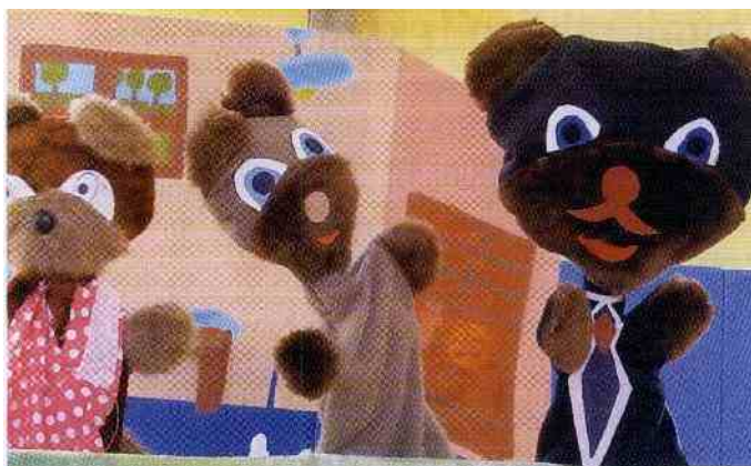
Prizor iz lutkovne igrice 'Lakota je najboljši kuhar'.

krožek OS Loče je sodeloval na Območnem srečanju otroških gledaliških skupin v soboto, v Radečah, predstavil se je z igro 'Laž in njen ženin', pod mentorstvom Svetlane Klemenčič . (E. N.)