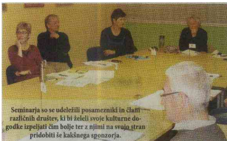
Seminarja so se udeležili posamezniki in člani različnih društev, ki bi želeli svoje kulturne dogodke izpeljati čim bolje ter z njimi na svojo stran pridobiti še kakšnega sponzorja.