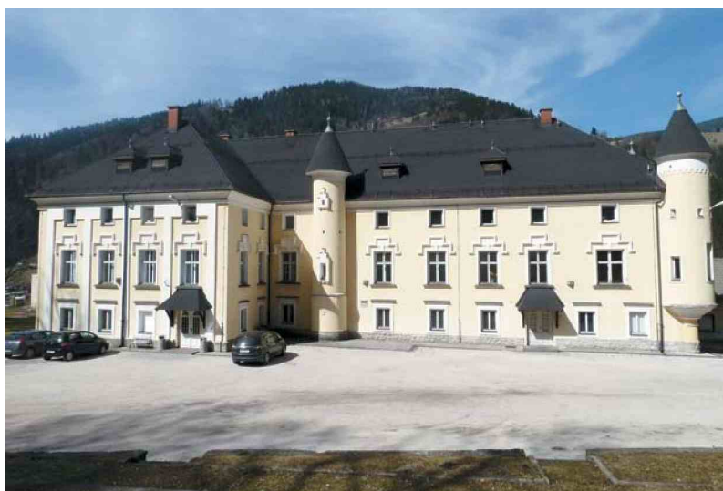
Dvorec Bukovje bo tudi tokrat prizorišče pesniške olimpijade.