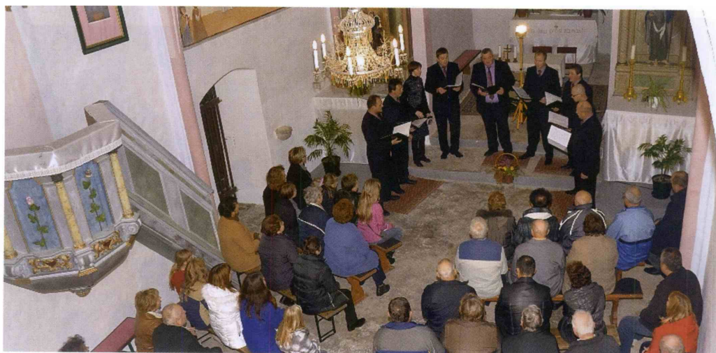
Oktet najraje nastopa v cerkvah na Tinskem. Jubilejni koncert so izvedli v cerkvi svete Ane

Kmalu smo si pa zazeleli tudi zgoščenke, da bi vsaj del bogatega repertoarja prihranili za naslednje rodove. Dela smo se lotili resno in odšli tudi na intenzivne v Bohinj, kjer so nam na srečo pocrkali fotoaparati, saj je bilo „ludo i nezaboravno“. Cd smo posneli, od takrat je minilo pet let, intenzivne vaje so pa ostale. Marsikaj se je spremenilo v teh letih, veselje ob petju pa ostaja. Veliko sem se naučila ob mojih dedih, upam, da tudi oni od mene kaj. Lepo obdobje se zaključuje, kaj prinaša prihodnost, se še ne ve, prepričana pa sem, da bo pevsko obarvana.“