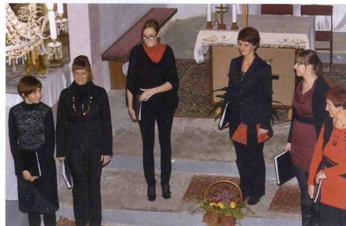
Vokalna skupina Libertas je stalna spremljevalka zibiškega okteta.