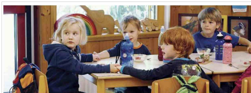
V šolah bi morala biti manj pristopa v stilu sedi, poslušaj in glej, boljše je aktivno učenje.