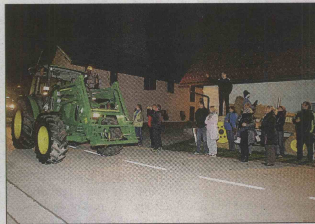
Rohenje traktorja je ljudem včasih bolj zanimivo.