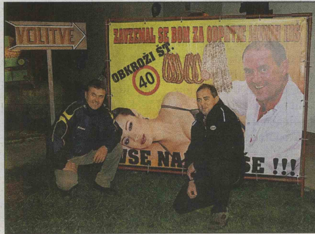
Posebni volilni oglas